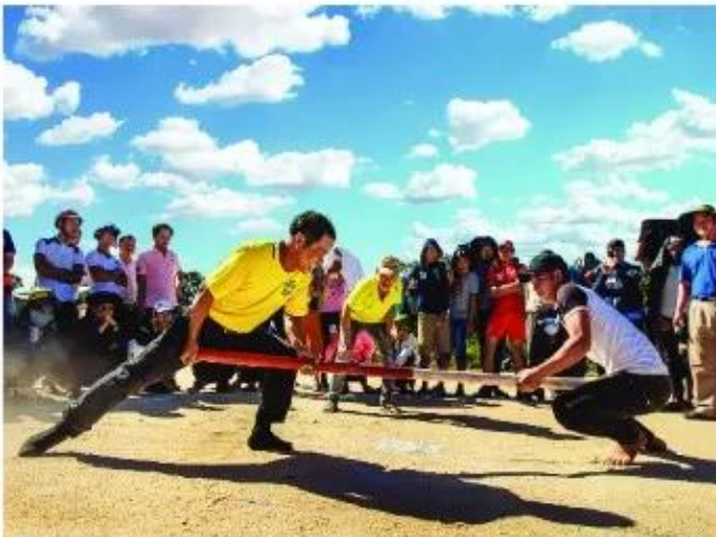
Đẩy gậy