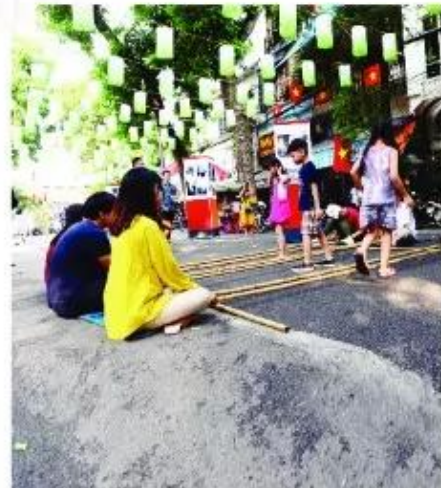
Nhảy sạp