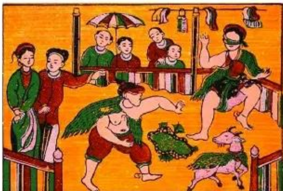
Bịt mắt bắt dê, tranh dân gian Đông Hồ