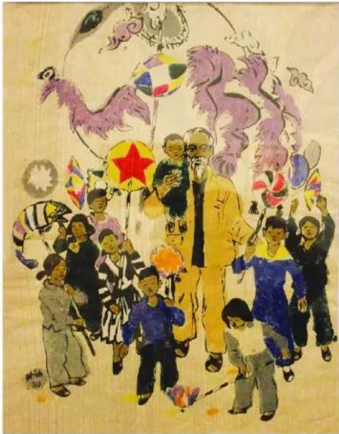
Bác Hồ với thiếu nhi, tranh khắc gỗ, Huy Oánh, 1980

Hãy chỉ ra cách xử lí tạo cân bằng trong tác phẩm dưới đây: