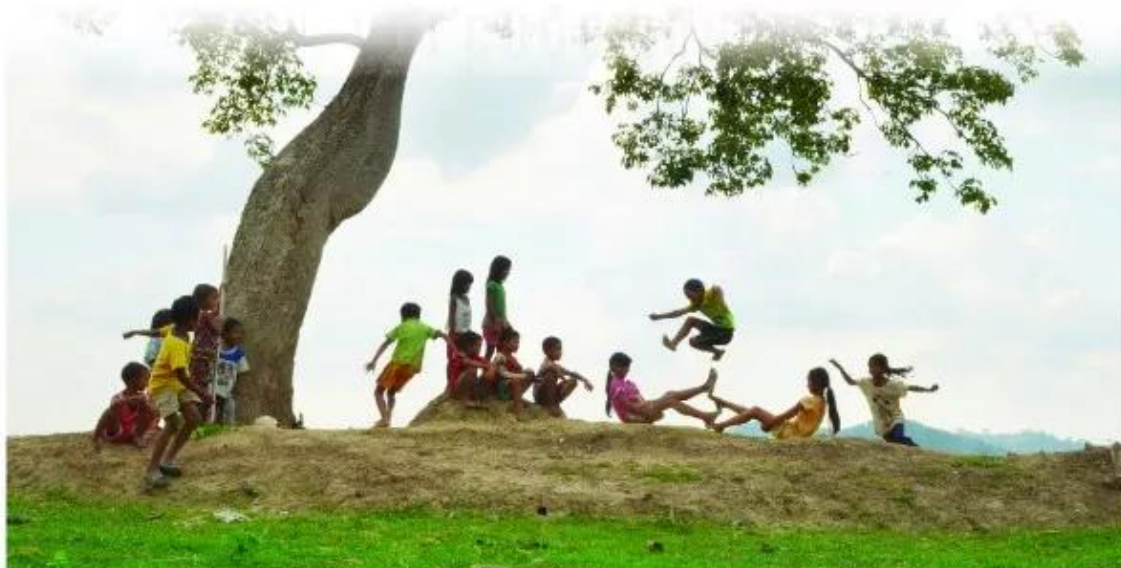
Trồng nụ trồng hoa