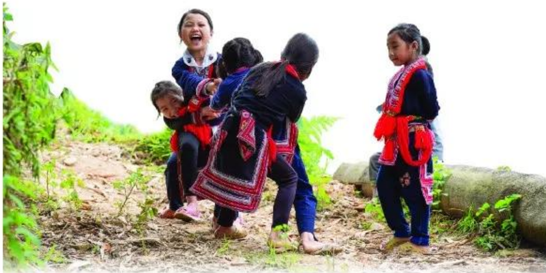
Kéo co