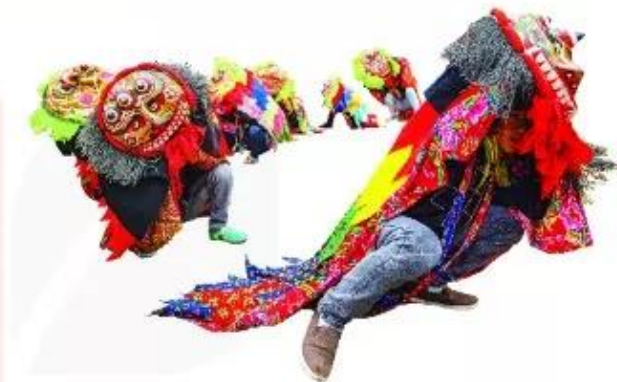
Múa sư tử của người H'mông

Trò chơi dân gian có từ thời xa xưa và được truyền lại đến ngày nay. Đây là chủ đề được thể hiện trong nhiều dòng tranh dân gian như: Đông Hồ, Hàng Trống,... qua đó giúp bảo tồn, phát huy những giá trị nghệ thuật qua nhiều thế hệ.