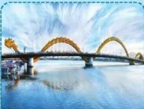
Cầu Rồng (Đà Nẵng)