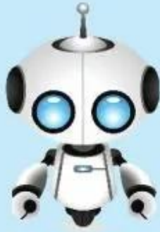
Robot (người máy)

Em hãy quan sát những hình ảnh dưới đây để nhận biết sản phẩm công nghệ.