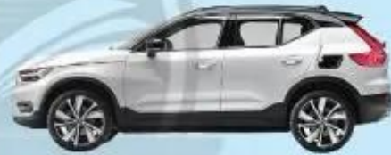
Xe ô tô