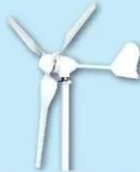
Máy phát điện gió