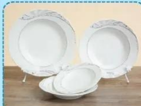
Đồ gốm sứ