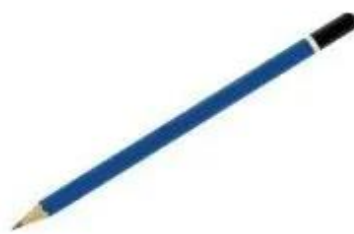
Bút chì mềm 2B