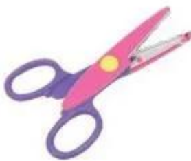
Kéo cắt giấy