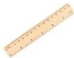
Thước kẻ nhựa 20 cm