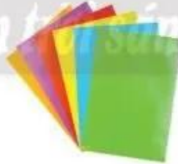
Giấy màu thủ công