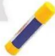
Keo dán giấy