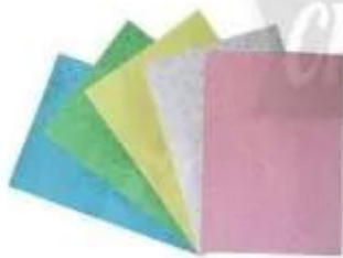
Giấy bìa cứng

Quan sát những vật liệu và dụng cụ để làm thước kẻ bằng giấy có trong hình dưới đây, hãy cho biết công dụng và cách sử dụng chúng.