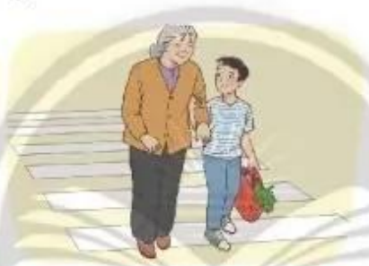
Người tốt việc tốt