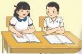
Đôi bạn cùng tiến

2. Dựa vào tranh và từ ngữ gợi ý, nói về những việc thiếu nhi đã làm theo lời Bác Hồ dạy: