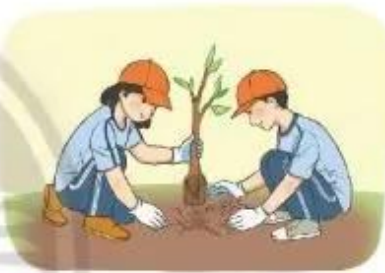
Trồng cây gây rừng