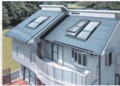
Sử dụng hệ thống đón gió và ánh sáng mặt trời