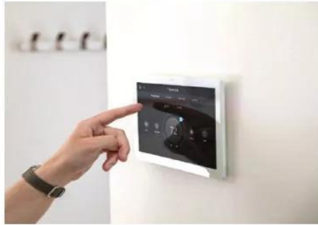
Cài đặt chương trình hoạt động của các đồ dùng điện trong nhà

Em hãy quan sát Hình 3.2 và trả lời các câu hỏi dưới đây: