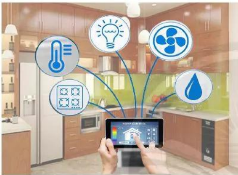
Giám sát hoạt động của các đồ dùng điện trong nhà bằng điện thoại thông minh