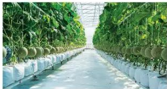
▲ Hình 1.7. Trồng dưa lưới

Trong cuộc sống, khoa học tự nhiên thể hiện ở nhiều vai trò khác nhau.