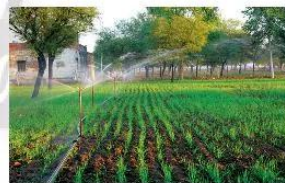
▲ Hệ thống tưới nước tự động

Hệ thống tưới nước tự động được bà con nông dân lắp đặt để tưới tiêu quy mô lớn. Hãy cho biết vai trò nào của khoa học tự nhiên trong hoạt động đó?