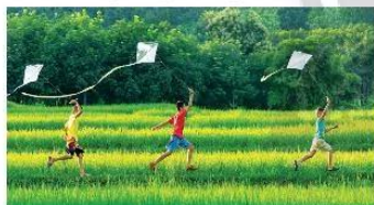
▲ Hình 1.1. Thả diều

1 Hoạt động nào trong các hình từ 1.1 đến 1.6 là hoạt động nghiên cứu khoa học?