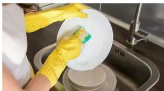
▲ Hình 1.4. Rửa bát, đĩa