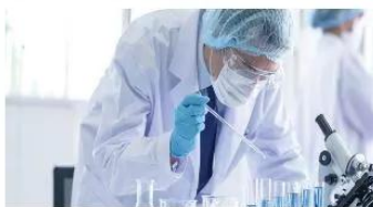
▲ Hình 1.6. Làm thí nghiệm