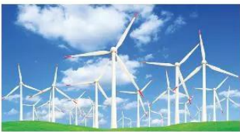
▲ Hình 1.9. Sử dụng năng lượng gió để sản xuất điện