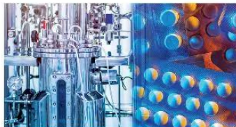
▲ Hình 1.8. Thiết bị sản xuất dược phẩm