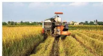
▲ Hình 1.3. Gặt lúa