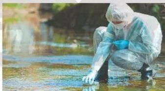
▲ Hình 1.2. Lấy mẫu nước nghiên cứu