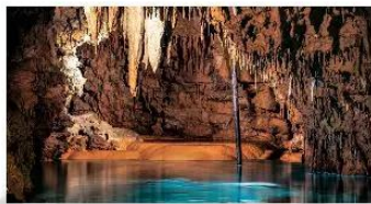
▲ Hình 1.10. Thạch nhũ tạo ra trong hang động