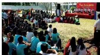
▲ Hình 1.5. Hoạt động tập thể