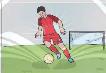
▲ Hình 38.1b. Cầu thủ chuyền bóng

Lực mà tay người nâng quả tạ và lực mà chân cầu thủ đá vào quả bóng được gọi là lực tiếp xúc.