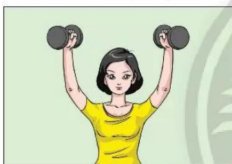
▲ Hình 38.1a. Cô gái nâng tạ