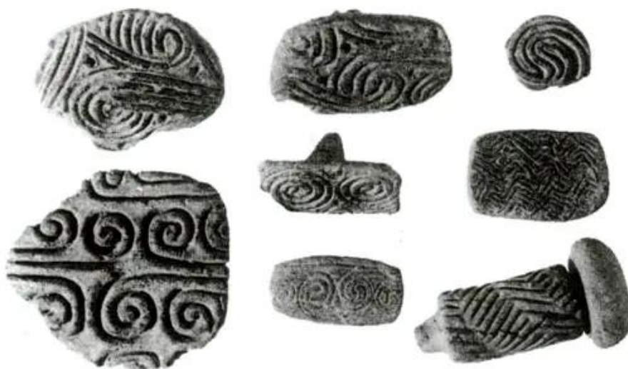
Hình 30 - Hoa văn trên đồ gốm Hoa Lộc

Em có nhận xét gì về trình độ sản xuất công cụ của người thời đó ?