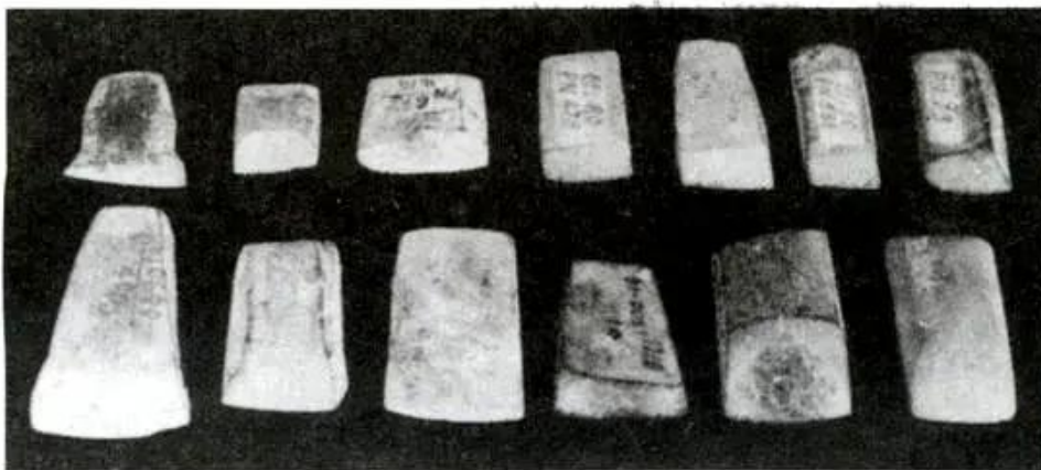
Hình 29 - Rìu đá Phùng Nguyên