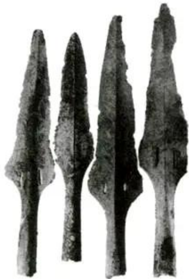
Hình 31 - Mũi giáo đồng Đông Sơn

Vào thời văn hoá Đông Sơn, công cụ sản xuất, đồ đựng, đồ trang sức đều phát triển hơn trước. Đồ đồng gần như thay thế đồ đá. Các nhà khảo cổ đã tìm thấy