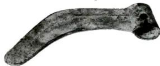
Hình 34 - Lưỡi liềm đồng