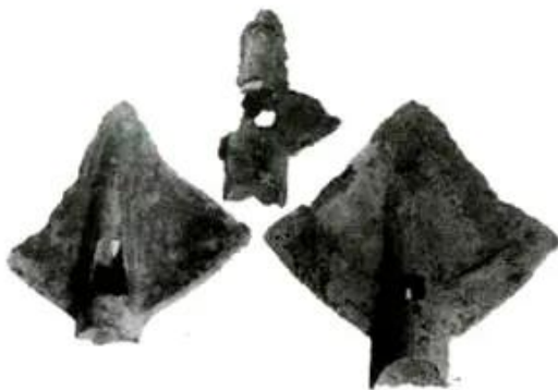
Hình 33 - Lưỡi cày đồng