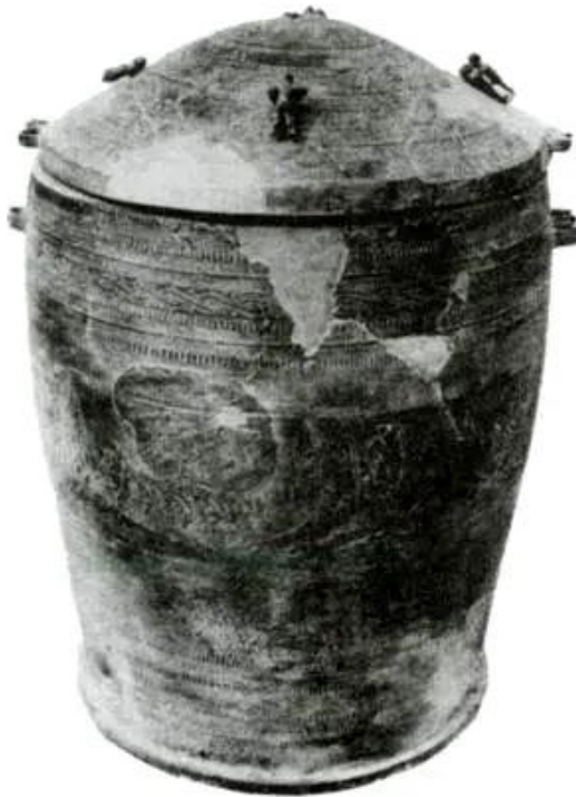
Hình 36 - Thạp đồng Đào Thịnh (Yên Bái)

Các nghề thủ công như làm đồ gốm, dệt vải, lụa, xây nhà, đóng thuyền được chuyên môn hoá.