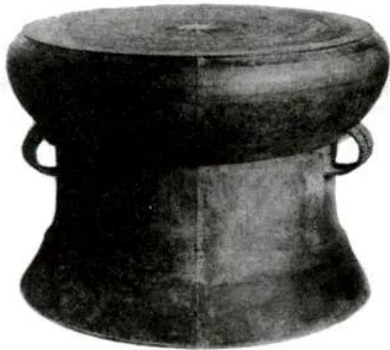
Hình 37 - Trống đồng Ngọc Lũ (Hà Nam)