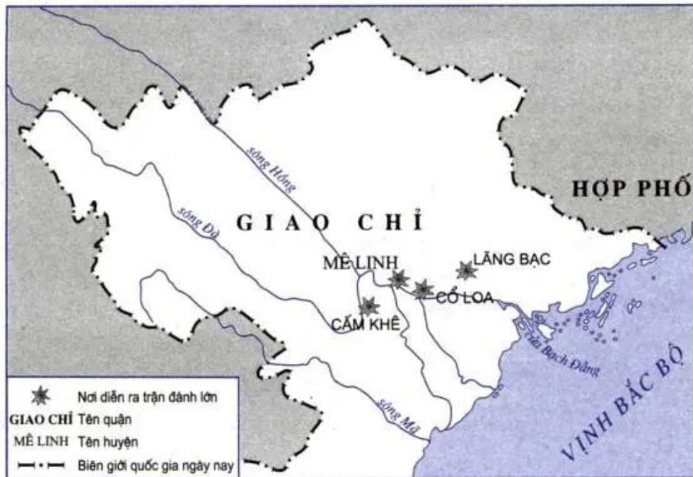
Hình 44 - Lược đồ : Kháng chiến chống quân xâm lược Hán

từ Hợp Phố vượt biển vào sông Bạch Đằng, rồi ngược lên vùng Lục Đầu. Tại đây, hai cánh quân thủy, bộ hợp lại ở Lãng Bạc.