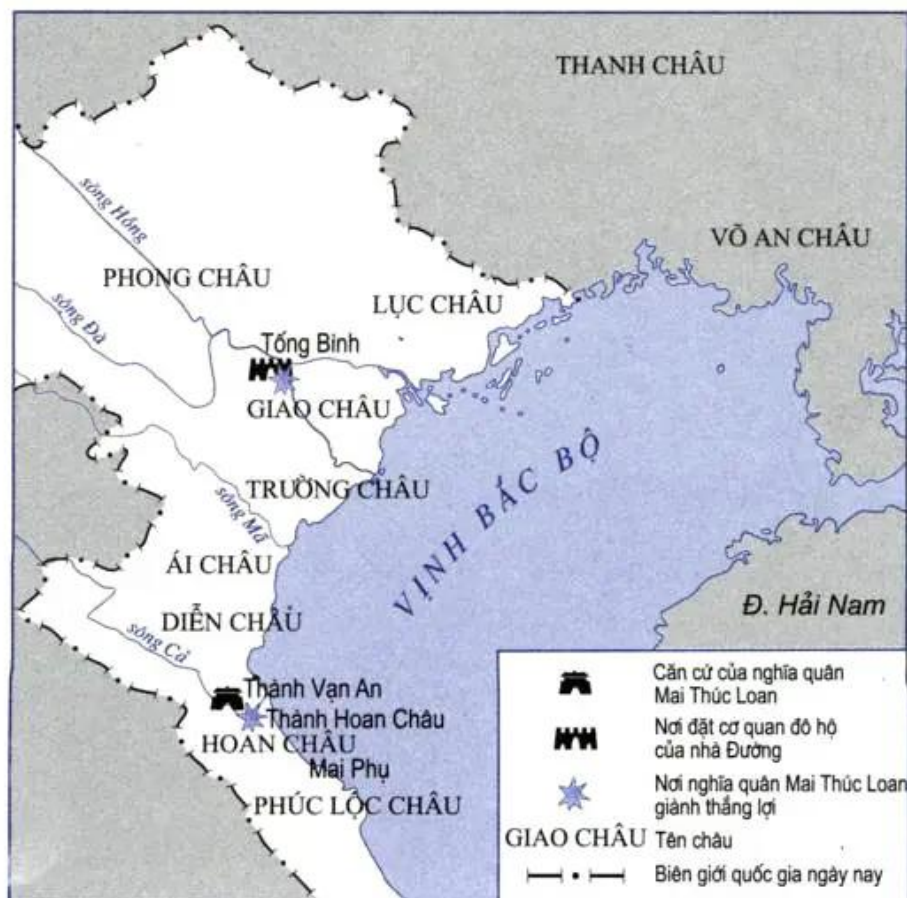
Hình 49 - Lược đồ : Khởi nghĩa Mai Thúc Loan

"Nhớ khi nội thuộc Đường triều Giang sơn, cố quốc nhiều điều ghê gai. Sâu quả vải vì ai vạch lá Ngựa hồng trần kẻ đã héo hon..."