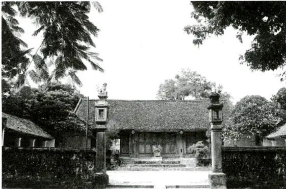
Hình 50 - Đình thờ Phùng Hưng ở Đường Lâm (Sơn Tây - Hà Nội)