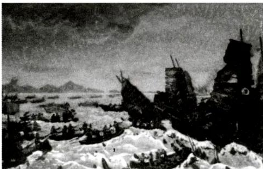
Hình 56 - Trận chiến trên sông Bạch Đằng