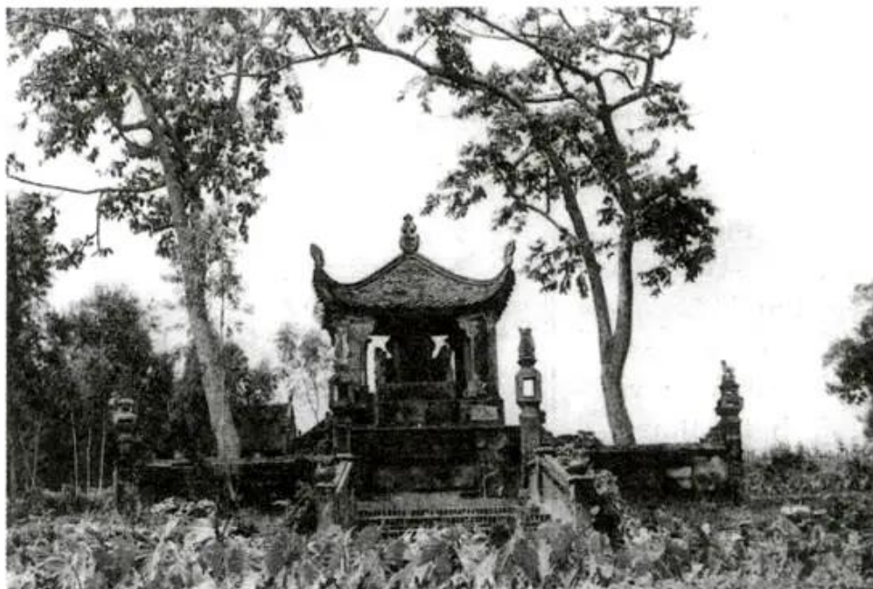
Hình 57 - Lăng Ngô Quyền (Đường Lâm - Sơn Tây - Hà Nội)

Vì sao lại nói : trận chiến trên sông Bạch Đằng năm 938 là một chiến thắng vĩ đại của dân tộc ta ?