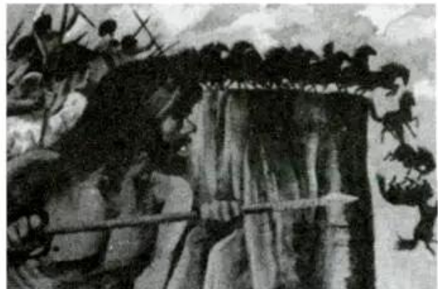
Hình 4 - Săn ngựa rừng