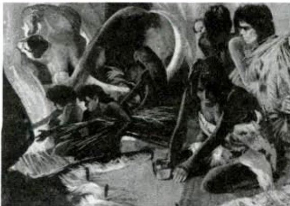
Hình 3 - Cuộc sống của người nguyên thủy