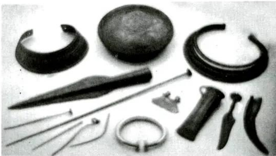
Hình 7 - Công cụ, đồ dùng và đồ trang sức bằng đồng

Nhờ công cụ bằng kim loại, con người có thể khai phá đất hoang, tăng diện tích trồng trọt, có thể xẻ gỗ đóng thuyền, xẻ đá làm nhà. Người ta có thể làm ra một lượng sản phẩm không chỉ đủ nuôi sống mình mà còn dư thừa. Một số người, do có khả năng lao động hoặc do chiếm đoạt một phần của cải dư thừa của người khác, đã ngày càng trở nên giàu có. Những người trong thị tộc giờ đây không thể cùng làm chung, hưởng chung. Xã hội nguyên thủy dần dần tan rã, nhường chỗ cho xã hội có giai cấp.