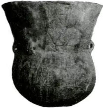
Hình 6 - Đồ đựng bằng gốm (khoảng 3000 năm TCN)

Nhờ công cụ bằng kim loại, con người có thể khai phá đất hoang, tăng diện tích trồng trọt, có thể xẻ gỗ đóng thuyền, xẻ đá làm nhà. Người ta có thể làm ra một lượng sản phẩm không chỉ đủ nuôi sống mình mà còn dư thừa. Một số người, do có khả năng lao động hoặc do chiếm đoạt một phần của cải dư thừa của người khác, đã ngày càng trở nên giàu có. Những người trong thị tộc giờ đây không thể cùng làm chung, hưởng chung. Xã hội nguyên thủy dần dần tan rã, nhường chỗ cho xã hội có giai cấp.