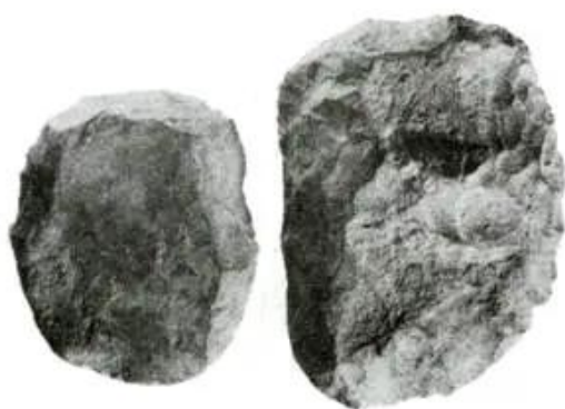
Hình 21 - Rìu đá Hoà Bình

So sánh công cụ ở hình 20 với các công cụ ở hình 21, 22, 23.