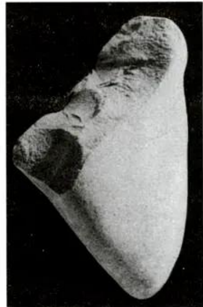
Hình 20 - Công cụ chặt ở Nậm Tùn (Lai Châu)

Họ cải tiến dần việc chế tác công cụ đá, làm tăng thêm nguồn thức ăn. Vào khoảng 3 - 2 vạn năm trước đây, họ chuyển thành Người tinh khôn. Dấu tích của Người tinh khôn được tìm thấy ở mái đá Ngườm (Thái Nguyên), Sơn Vi (Phú Thọ) và nhiều nơi khác thuộc Lai Châu, Sơn La, Bắc Giang, Thanh Hoá, Nghệ An. Công cụ chủ yếu của họ là những chiếc rìu bằng hòn cuội, được ghè đẽo thô sơ, có hình thù rõ ràng.