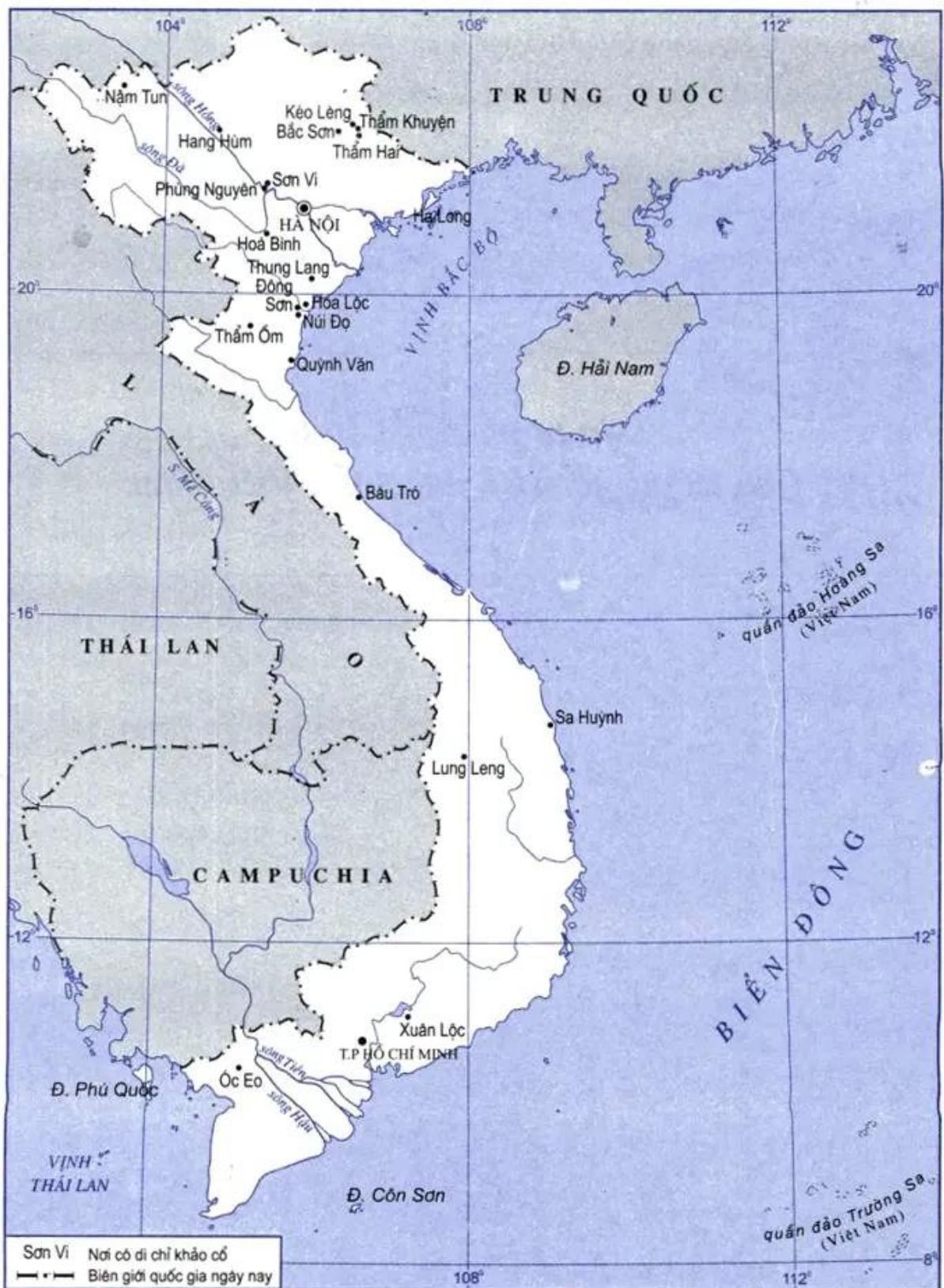
Hình 24 - Lược đồ : Một số di chỉ khảo cổ ở Việt Nam