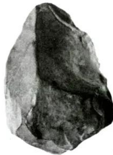
Hình 19 - Rìu đá núi Đọ (Thanh Hoá)