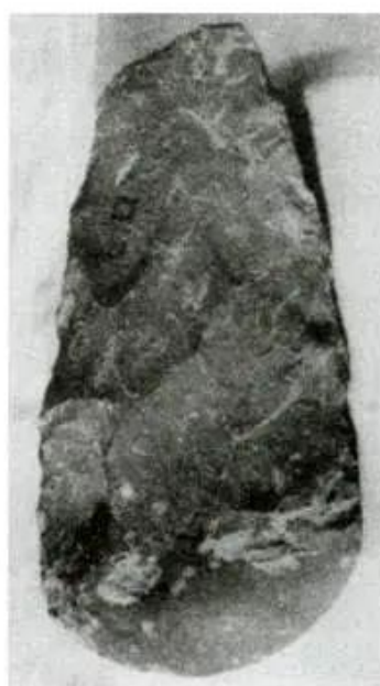
Hình 22 - Rìu đá Bắc Sơn