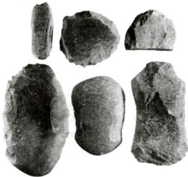
Hình 25 - Các loại rìu đá thuộc văn hoá Hoà Bình - Bắc Sơn

Trong quá trình sinh sống, người nguyên thủy thời Sơn Vi - Hoà Bình - Bắc Sơn - Hạ Long thường xuyên tìm cách cải tiến công cụ lao động. Nguyên liệu chủ yếu là đá. Ban đầu, người thời Sơn Vi chỉ biết ghè đẽo các hòn cuội ven suối làm rìu, nhưng đến thời Hoà Bình - Bắc Sơn - Hạ Long, họ đã biết mài đá, dùng nhiều loại đá khác nhau để làm công cụ các loại như rìu, bôn (1) , chày. Họ còn biết dùng tre, gỗ, xương, sừng làm công cụ và đồ dùng cần thiết, sau đó biết làm đồ gốm.