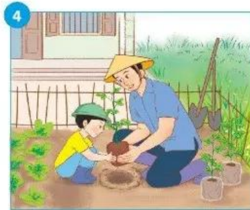
đặt bầu cây vào hố