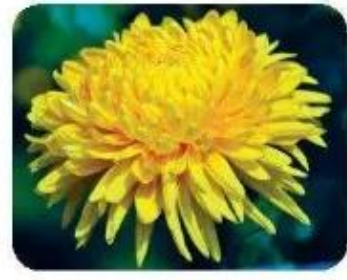
hoa cúc 🌸