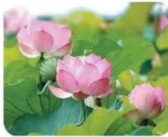
hoa sen 🌸