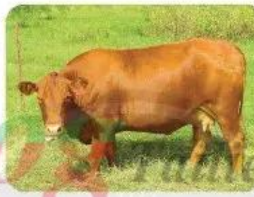
con bò 🌸