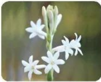
M: hoa huệ trắng tinh