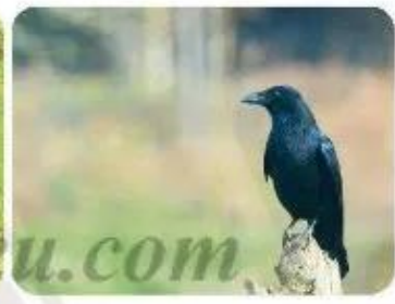
con quạ 🌸