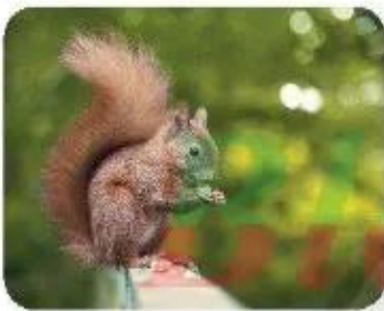
con sóc 🌸