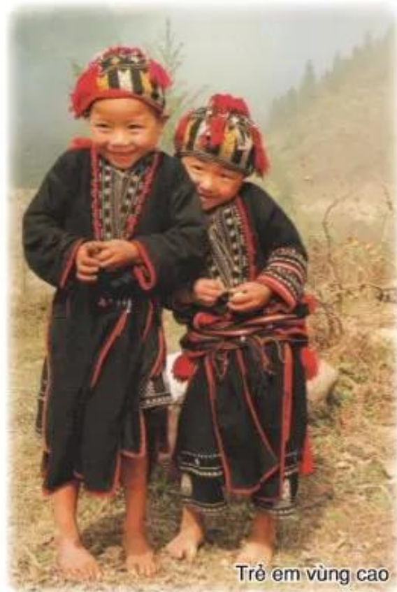
Trẻ em vùng cao

Dân số nước ta thuộc loại trẻ, nhưng đang có sự biến đổi nhanh chóng về cơ cấu dân số theo nhóm tuổi của cả nước.