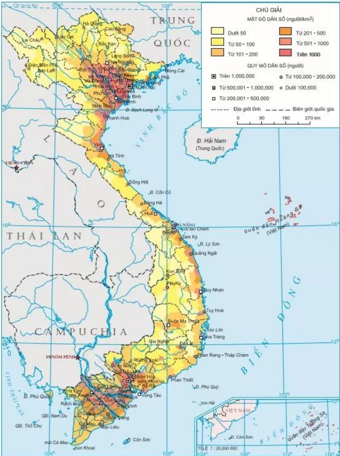
Hình 21.2. Phân bố dân cư