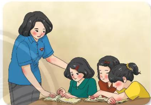
Sinh viên tình nguyện tham gia Mùa hè xanh.