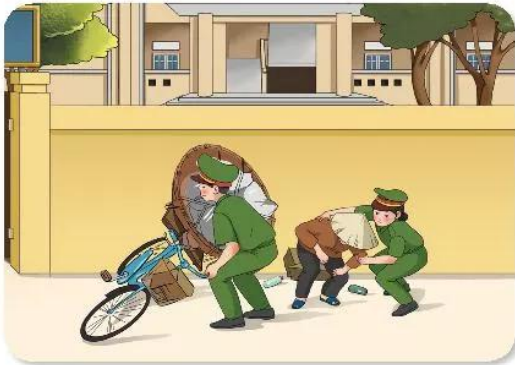
Các chiến sĩ công an tận tình giúp đỡ người dân.