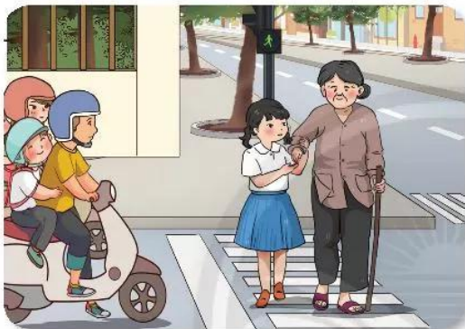
Một bạn học sinh dẫn cụ bà qua đường.