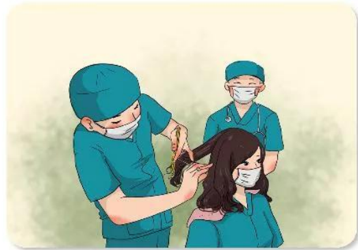
Các nữ bác sĩ cắt ngắn mái tóc để lên tuyến đầu chống dịch COVID-19.