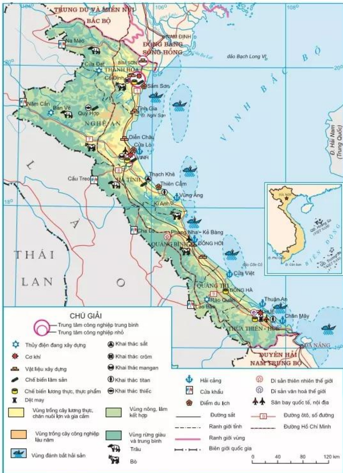
Hình 35.2. Khai thác một số thế mạnh chủ yếu của vùng Bắc Trung Bộ