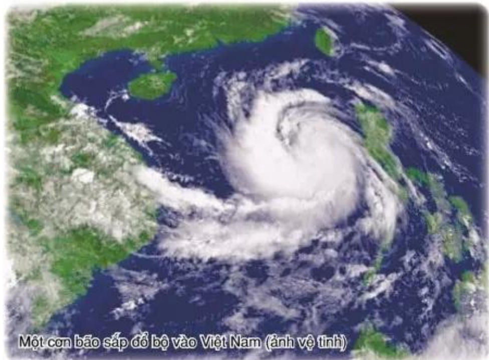
Một cơn bão sắp đổ bộ vào Việt Nam (ảnh vệ tinh)