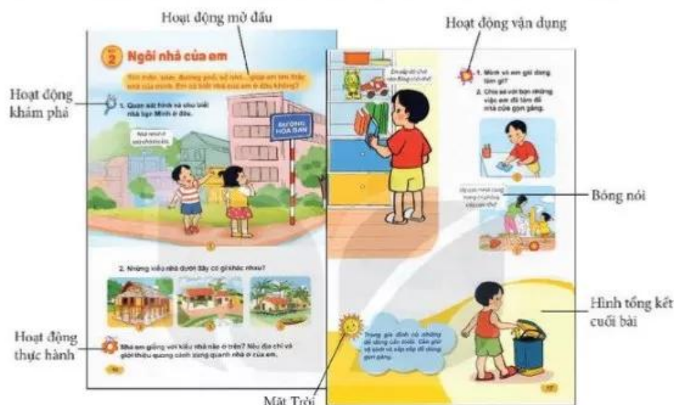
Hình 3. Cấu trúc một bài học

Mỗi bài học mới được cấu trúc gồm 4 hoạt động: Mở đầu, khám phá, thực hành, vận dụng (hình 3). Tuy nhiên, với hoạt động mở đầu GV có thể chủ động lựa chọn để phù hợp với nội dung bài học, tiết học, với điều kiện cụ thể của từng trường lớp và địa phương.