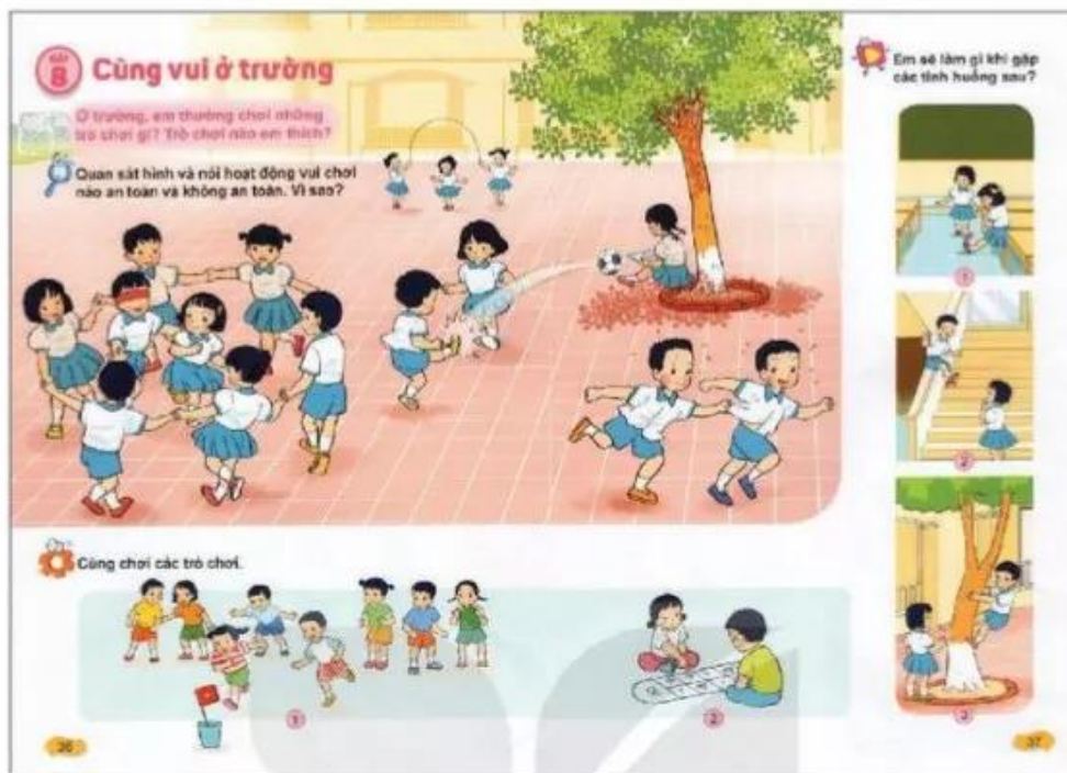
Hình 1. Một tiết học – Hai trang mở

Cuối mỗi bài học có lời dẫn dắt, nhắc nhở của Mặt Trời và hình tổng kết kiến thức thái độ, hành vi của HS được thiết kế gắn liền với nhau (hình 2). Đây là gợi ý và mong muốn đạt được ở HS sau mỗi bài học theo hướng phát triển năng lực.