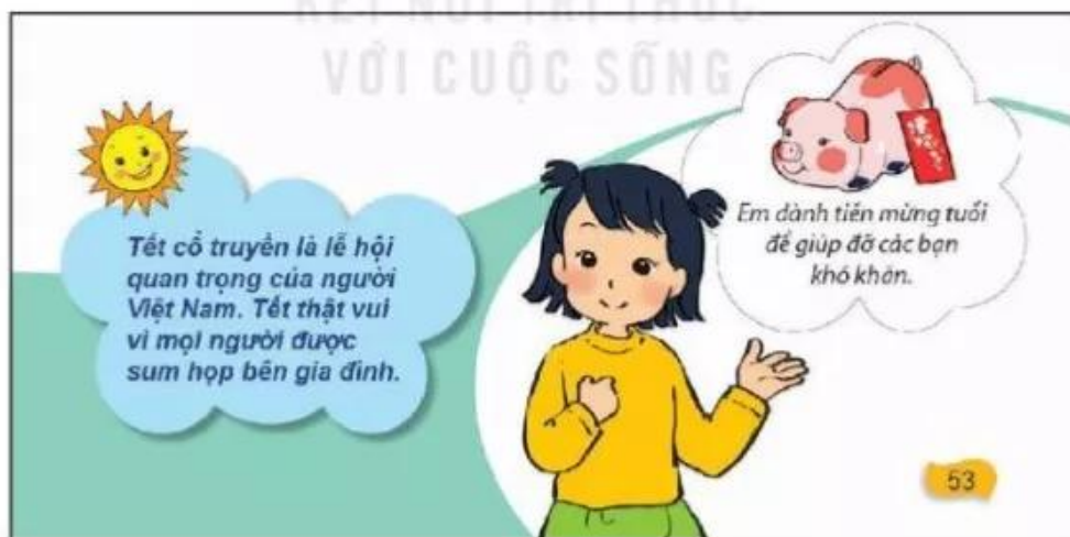
Hình 2. Hình tổng kết cuối bài

Cuối mỗi bài học có lời dẫn dắt, nhắc nhở của Mặt Trời và hình tổng kết kiến thức thái độ, hành vi của HS được thiết kế gắn liền với nhau (hình 2). Đây là gợi ý và mong muốn đạt được ở HS sau mỗi bài học theo hướng phát triển năng lực.