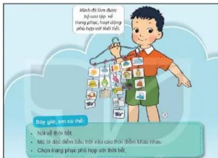
Hình 4. Hoạt động tự đánh giá của HS sau mỗi chủ đề