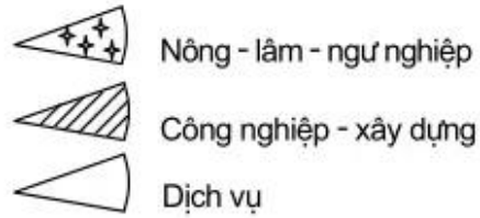
Biểu đồ cơ cấu GDP theo ngành của nước ta, năm 2008

b) Nhận xét về sự đóng góp của ngành dịch vụ trong GDP nước ta.