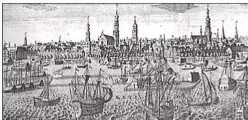
Hình 2. Một góc hải cảng Am-xtéc-đam thế kỉ XVII

Cách mạng Hà Lan thắng lợi, chế độ thống trị của phong kiến Tây Ban Nha ở Nê-đéc-lan bị lật đổ, mở đường cho chủ nghĩa tư bản phát triển. Việc sản xuất trong các ngành nghề dệt len, dệt vải, nhuộm, in, thủy tinh và chế tạo kính quang học... được đẩy mạnh. Thương nghiệp phát triển, nhiều tàu thuyền của Các tỉnh Liên hiệp hoạt động nhộn nhịp trong và ngoài nước. Vào đầu thế kỉ XVII, Am-xtéc-đam có đến 10 vạn dân, tiếp nhận hàng nghìn tàu thuyền thường xuyên ra vào cảng, buôn bán với các nước Anh, Pháp, Nga, Ấn Độ... Các công ti thương mại của Hà Lan như : “Công ti Phương Đông”, “Công ti Đông Ấn”... không chỉ mở rộng việc buôn bán với nhiều nước trên thế giới mà còn tiến hành việc xâm chiếm thuộc địa. In-đô-nê-xi-a trở thành thuộc địa lớn nhất của Hà Lan.