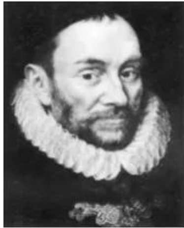
Hình 1. V. Ô-ran-giơ (1533 _ 1584)

Quý tộc lớp trên của Nê-đéc-lan, được sự giúp đỡ của nước ngoài, lập một đội quân đánh thuê đưa về nước để lật đổ ách thống trị Tây Ban Nha, song bị đánh tan vào năm 1568.