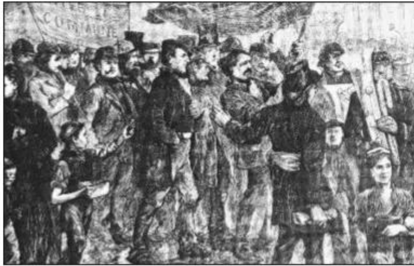
Hình 40. Quân chúng Pa-ri hân hoan đón chào Hội đồng Công xã