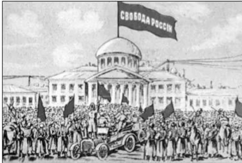
Hình 63. Tự do cho nước Nga (tranh vẽ năm 1917 về Cách mạng tháng Hai)

Tháng 2 – 1917 (theo lịch Nga) (1) , Cách mạng dân chủ tư sản đã bùng nổ ở Nga. Mở đầu là cuộc biểu tình ngày 23 – 2 (tức 8 – 3 theo dương lịch) của 9 vạn nữ công nhân ở Pê-tơ-rô-grát (nay là Xanh Pê-téc-bua). Ngày 27 – 2 (12 – 3), cuộc tổng bãi công lan rộng khắp thành phố. Dưới sự lãnh đạo của Đảng Bôn-sê-vích, công nhân chuyển từ tổng bãi công chính trị sang khởi nghĩa vũ trang.