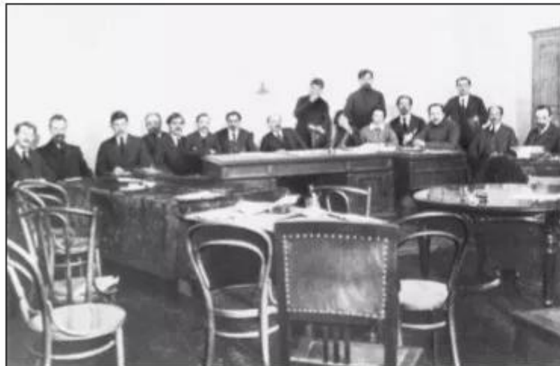
Hình 65. Hội đồng các Dân uỷ (Bộ trưởng) đầu tiên của nước Nga Xô viết (Điện Xmô-nôi, tháng 1 _ 1918)

Sắc lệnh hoà bình lên án cuộc chiến tranh đế quốc là “một tội ác lớn nhất đối với nhân loại” và đề nghị các nước tham chiến hãy nhanh chóng đàm phán để kí một hoà ước dân chủ và công bằng – không có thôn tính đất đai và bồi thường chiến tranh. Sắc lệnh ruộng đất tuyên bố tịch thu ruộng đất của địa chủ, quý tộc và Giáo hội, quốc hữu hoá toàn bộ ruộng đất. Từ mùa xuân năm 1918, Sắc lệnh ruộng đất bắt đầu được thực hiện. Nông dân đã được nhận hơn 150 triệu hécta ruộng đất, thực hiện mơ ước từ lâu đời của mình.