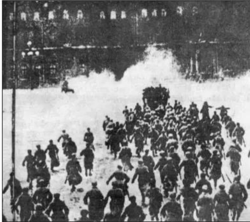
Hình 64. Cuộc tấn công Cung điện Mùa Đông

Tiếp theo thắng lợi ở Pê-tơ-rô-grát, Chính quyền Xô viết được thành lập ở Mát-xcơ-va đầu tháng 11 – 1917. Sau thắng lợi ở hai trung tâm quan trọng là Pê-tơ-rô-grát và Mát-xcơ-va, cuộc khởi nghĩa giành chính quyền ở các địa phương diễn ra mạnh mẽ.