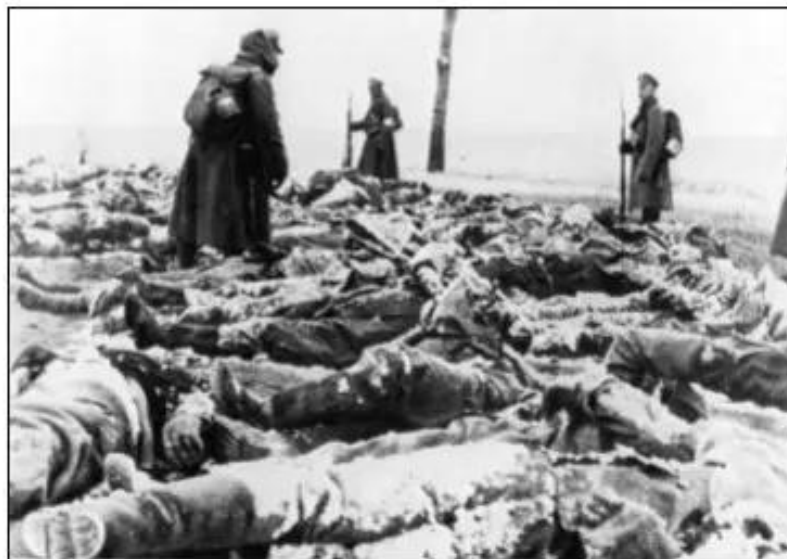
Hình 62. Những người lính Nga ngoài mặt trận, tháng 1 _ 1917

Phong trào phản đối chiến tranh, đòi lật đổ chế độ Nga hoàng lan rộng khắp nơi. Chính phủ Nga hoàng ngày càng trở nên bất lực, không còn khả năng tiếp tục thống trị như cũ được nữa. Nước Nga đã tiến sát tới một cuộc cách mạng.