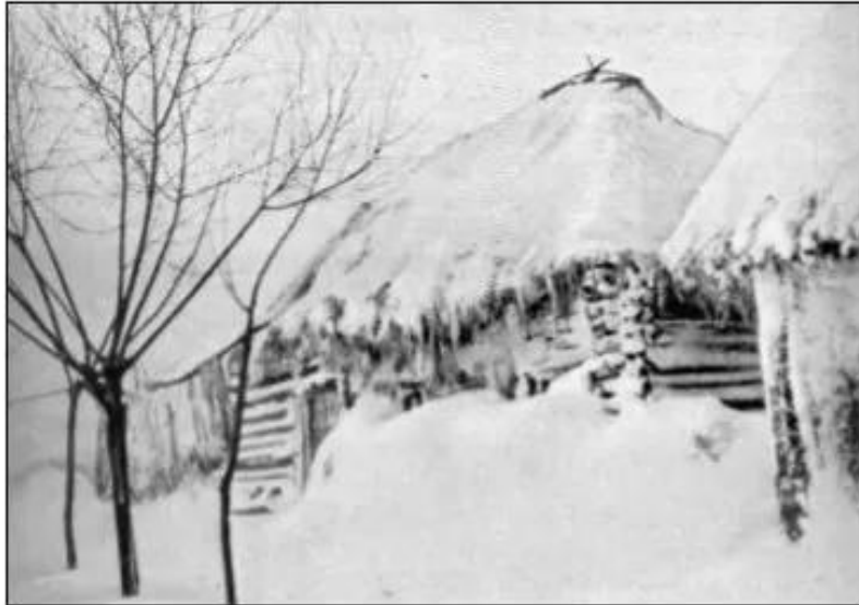
Hình 61. Nơi ở của nhân dân Nga năm 1917

Nền kinh tế của nước Nga lạc hậu, không chịu đựng được tình trạng căng thẳng của chiến tranh. Ngoài mặt trận, quân đội liên tiếp thất bại. Tính đến đầu năm 1917, có tới 1,5 triệu người chết và trên 4 triệu người bị thương.