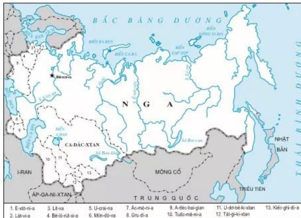
Hình 68. Lược đồ Liên Xô năm 1940

Kế hoạch 5 năm lần thứ hai (1933 – 1937) nhằm tiếp tục công cuộc công nghiệp hoá, hoàn thành việc trang bị cơ sở kỹ thuật hiện đại cho toàn bộ nền kinh tế quốc dân, hoàn thành tập thể hoá nông nghiệp trong cả nước. Kế hoạch 5 năm lần thứ hai đã hoàn thành trước thời hạn 9 tháng.