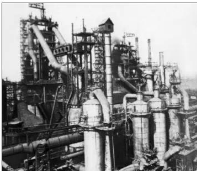
Hình 69. Nhà máy liên hợp luyện kim Ma-nhi-tô-goóc-xơ được xây dựng trong những năm 1929 _ 1934

Với khẩu hiệu “Vượt trước thời gian”, hàng triệu người dân Liên Xô đã lao động quên mình để hoàn thành những nhiệm vụ của kế hoạch 5 năm.