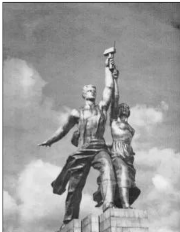
Hình 70. Liên minh công nông _ biểu tượng sức mạnh đoàn kết của Liên bang Xô viết

Về văn hoá, giáo dục, Liên Xô đã thanh toán được nạn mù chữ, xây dựng hệ thống giáo dục quốc dân thống nhất, hoàn thành phổ cập giáo dục tiểu học trong cả nước và thực hiện phổ cập giáo dục trung học cơ sở ở các thành phố. Đội ngũ trí thức Xô viết lên tới 10 triệu người vào năm 1937.