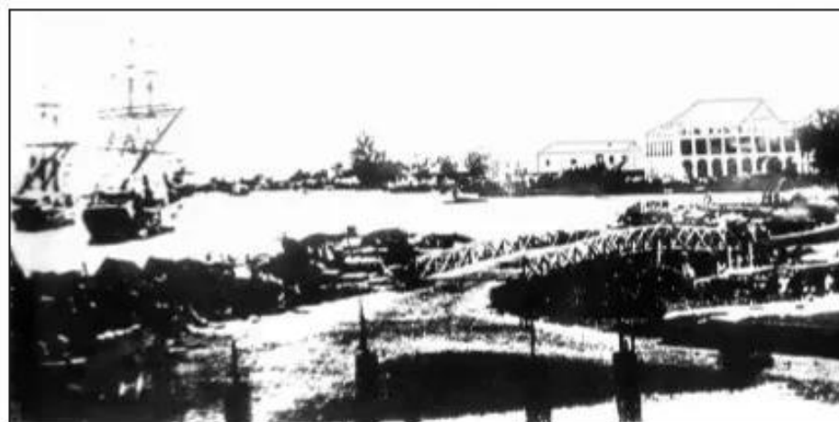
Hình 130. Bến cảng Nhà Rồng đầu thế kỉ XX

Sau khi tham gia cuộc biểu tình chống thuế của nông dân Thừa Thiên – Huế (5 – 1908), Nguyễn Tất Thành bí mật lên đường vào Nam. Trên đường đi, Người đã dừng chân dạy học ở trường Dục Thanh (Phan Thiết) – trường học do một số nhà nho yêu nước lập ra. Đầu năm 1911, Người vào Sài Gòn tìm cơ hội đi ra nước ngoài để “xem xét họ làm như thế nào” (1) , rồi trở về giúp đồng bào, giải phóng dân tộc.