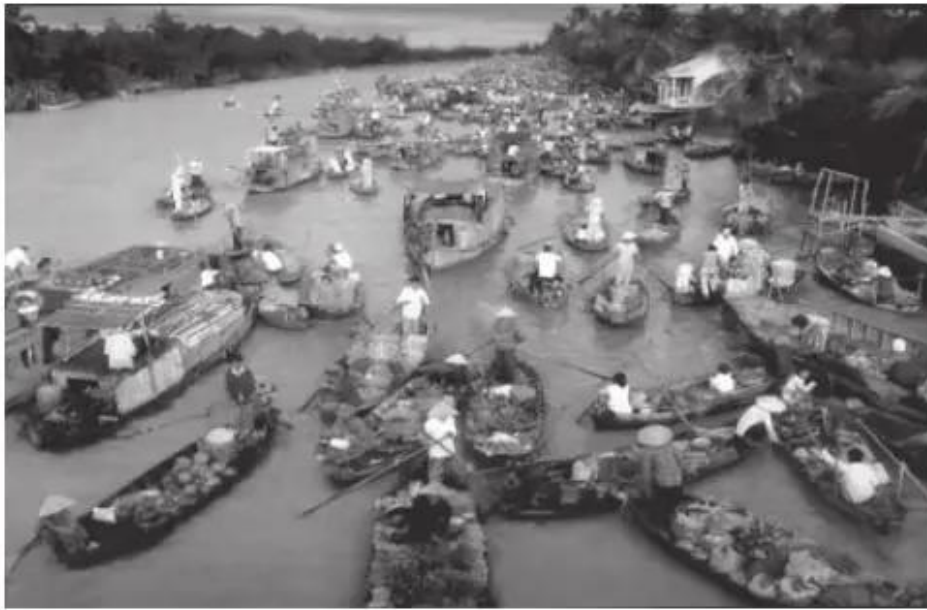
Chợ nổi trên sông ở Cần Thơ

3. Dựa vào hình dưới đây, em hãy viết một đoạn văn ngắn mô tả về chợ nổi trên sông.