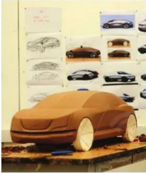
Mô hình xe ô tô bằng đất