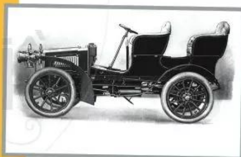
Xe Benz-Parsifal (Karl Friedrich Michael Benz, 1903)