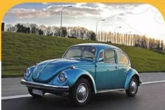
Xe Volkswagen-1302, 1970