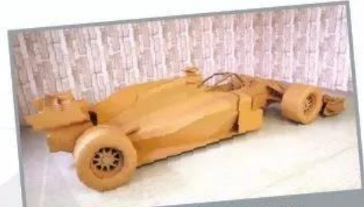
Mô hình xe đua F1 bằng bìa carton