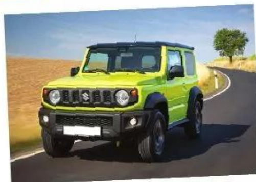
Xe Suzuki-Jimny, 2020