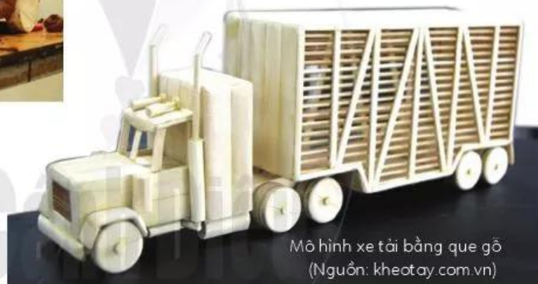
Mô hình xe tải bằng que gỗ