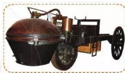
Xe Cugnot Fardier (Nicolas-Joseph Cugnot, 1769)