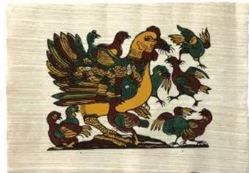
Gà đàn (Tranh Đông Hồ)