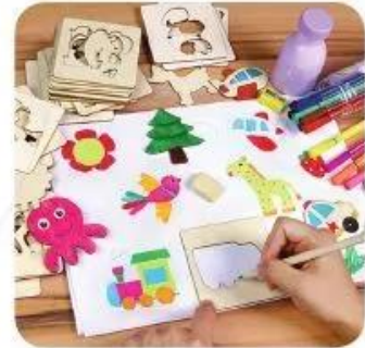
Khuôn vẽ hình