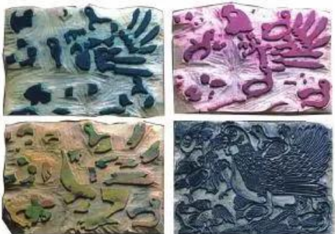
Bộ bản khắc gỗ tranh Gà đàn (Tranh Đông Hồ)