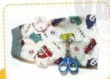
3. Cắt vòng chân với kích thước đã đo