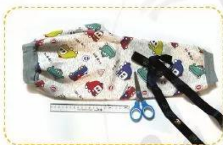
1. Dụng cụ, nguyên liệu