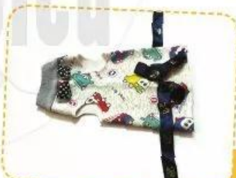
4. Gắn phụ kiện trang trí