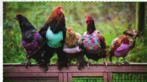
Chống rét cho gà