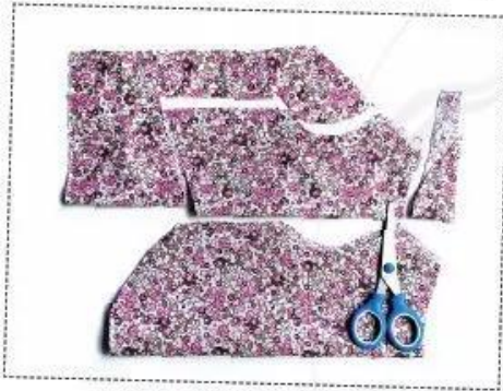
Gấp đôi miếng vải, cắt vòng cổ, vòng chân và thân sau với kích thước đã đo cho con vật