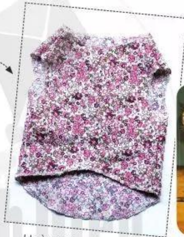
Hoàn thiện sản phẩm