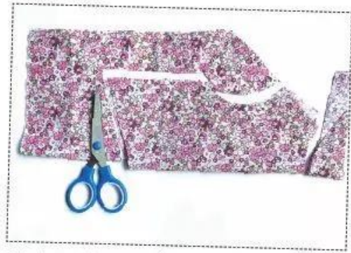
Gấp đôi miếng vải, cắt vòng cổ, vòng chân và thân trước với kích thước đã đo cho con vật