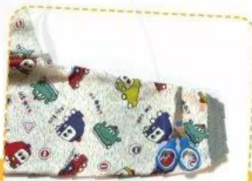
2. Cắt và sử dụng một ống quần