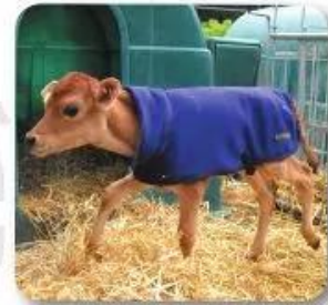
Tấm áo được thiết kế đơn giản