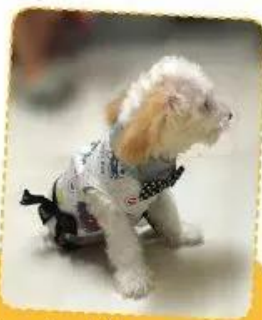
5. Hoàn thiện sản phẩm