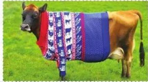
Chống rét cho bò

Em hãy tham khảo cách trang trí ở hình bên để vận dụng vào việc thiết kế thời trang cho vật nuôi.