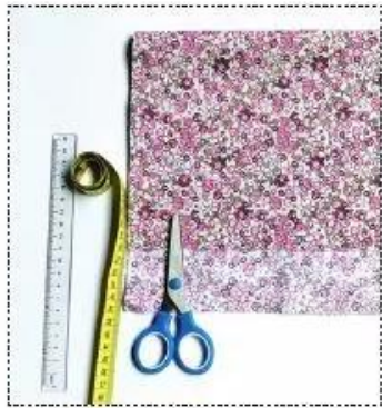
Dụng cụ, nguyên liệu