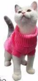
Thời trang cho mèo

Em hãy quan sát các hình ảnh và cho biết: