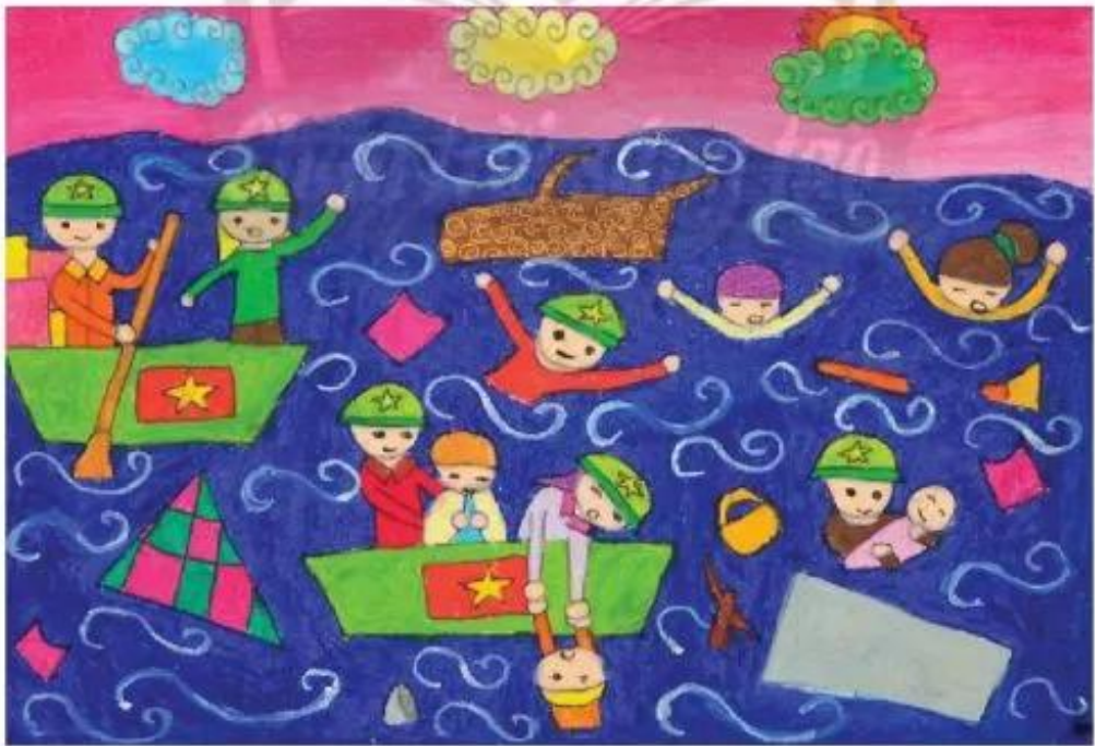
Bộ đội cứu dân miền Trung trong cơn lũ. Phan Kiều Nhi, màu sáp ③