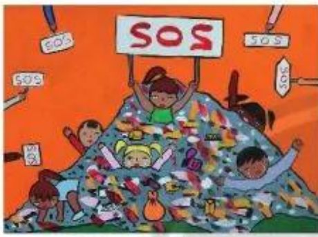
Hãy cứu chúng em. Hồ Trần Hoàng, màu gỗ ①

Một số sản phẩm mỹ thuật về ô nhiễm môi trường