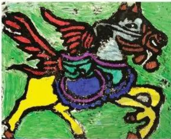
Ngựa. Thu Hiền, màu dạ

Một số sản phẩm mỹ thuật vẽ sáng tạo màu cùng tranh dân gian