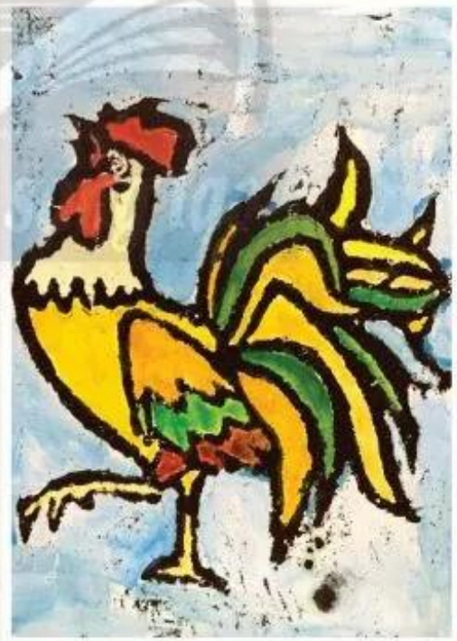
Gà trống. Lê Thủy, màu nước