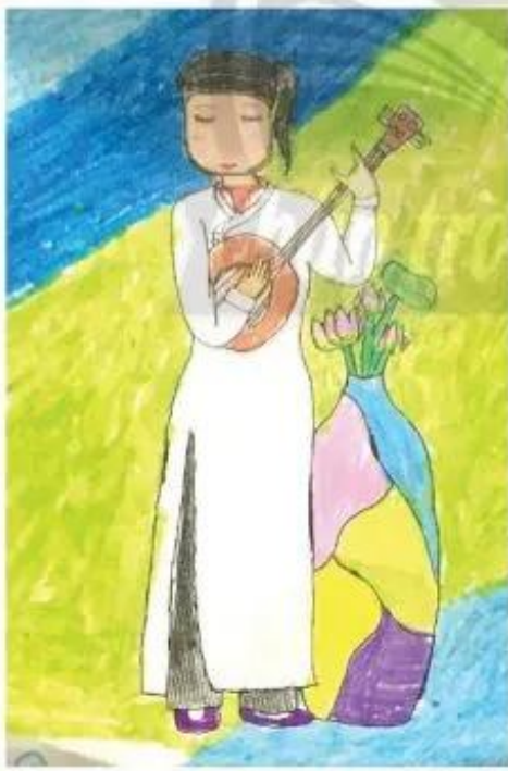
Thiếu nữ. Đặng Khuê, màu sáp