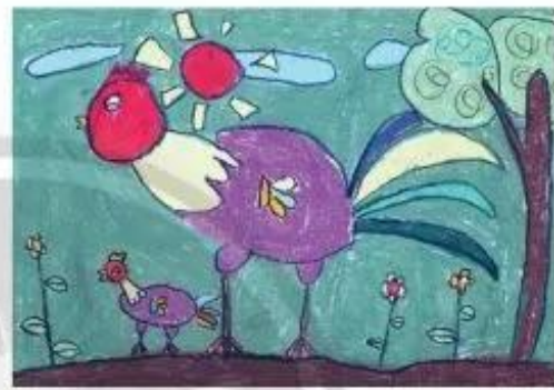
Con gà nhà em.