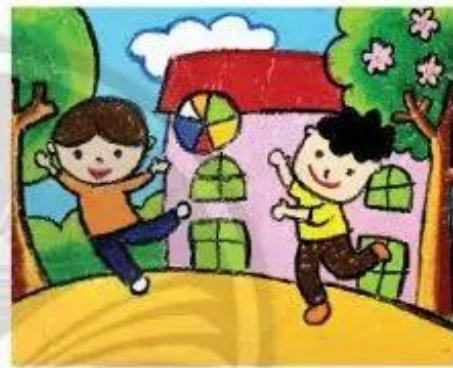
Đá banh. Già Huy, màu sáp