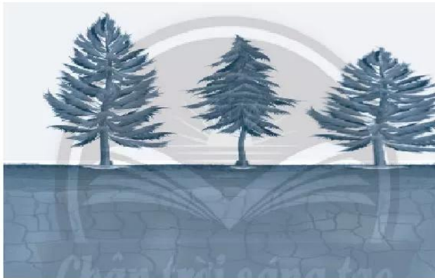
Hình 19.2. Đất ở vùng khí hậu ôn đới