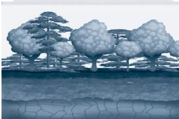
Hình 19.3. Đất ở vùng khí hậu nhiệt đới