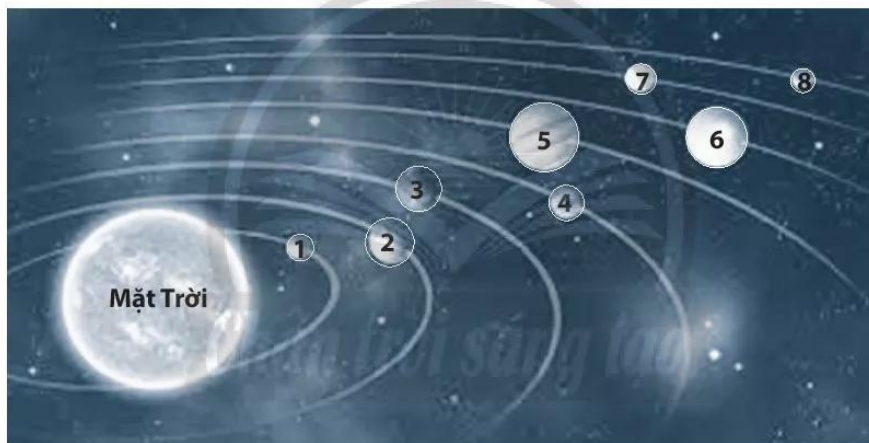
Hình 5.1. Trái Đất trong hệ Mặt Trời

Câu 1. Căn cứ vào hình 5.1, hãy điền tên các hành tinh trong hệ Mặt Trời theo thứ tự từ 1 đến 8.