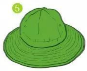
mũ tai bèo