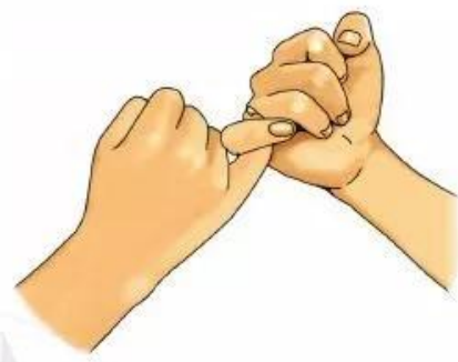
con ho ắ ng