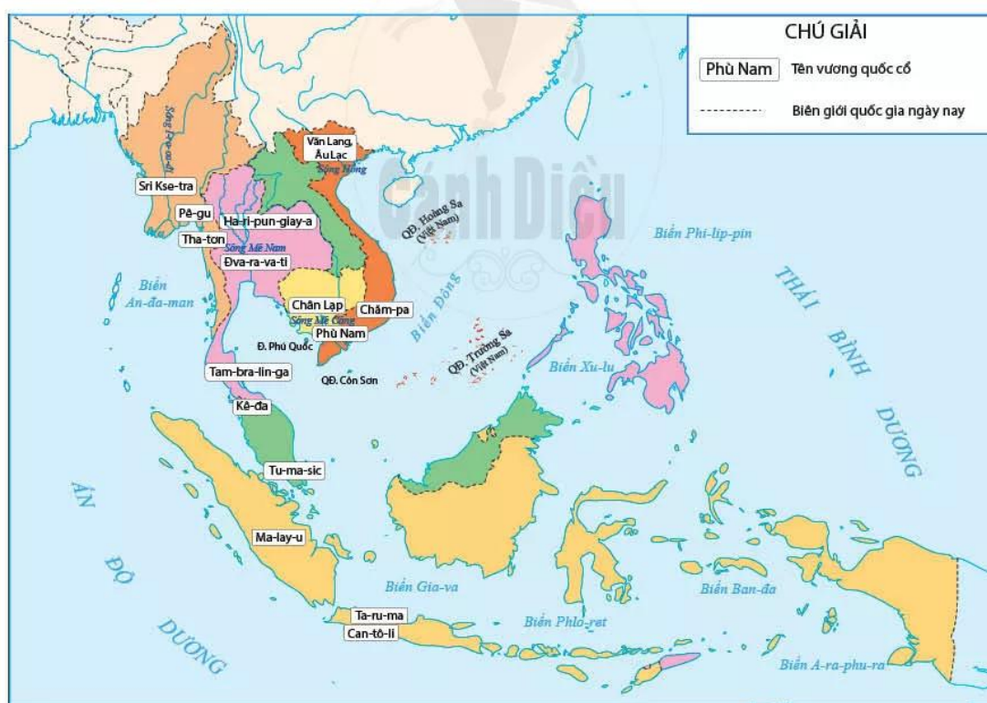
Hình 10.2. Lược đồ các vương quốc cổ ở Đông Nam Á (từ thế kỉ VII TCN đến thế kỉ VII)

Tên bán đảo Mã Lai hình thành các vương quốc như Kê-đa, Tam-bra-lin-ga, Tu-ma-sic. Trên lãnh thổ của In-đô-nê-xi-a ngày nay đã ra đời các vương quốc như Ma-lay-u, Ta-ru-ma, Can-tô-li.