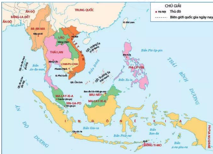
Hình 10.1. Lược đồ các nước Đông Nam Á ngày nay