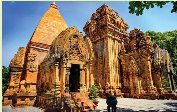
Hình 11.8. Tháp Pô Na-ga (Nha Trang, Khánh Hoà, Việt Nam)

Tháp Pô Na-ga là một công trình kiến trúc chịu ảnh hưởng sâu đậm của văn hoá Ấn Độ. Hiện nay, tháp Pô Na-ga là một địa điểm du lịch hấp dẫn của du khách khi đến tham quan thành phố Nha Trang.