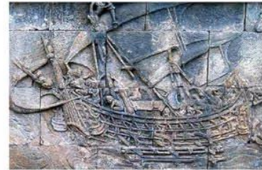
Hình 11.1. Phù điêu chiếc thuyền ở đền Bô-rô-bu-đua (In-đô-nê-xi-a, thế kỉ VIII - IX)

Quá trình giao lưu thương mại và văn hoá tác động đến Đông Nam Á như thế nào?