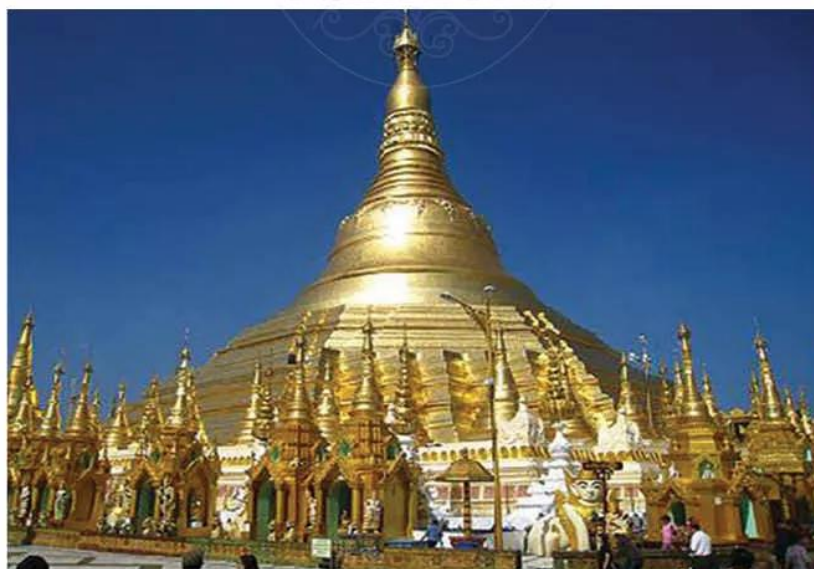
Hình 11.6. Chùa Suê-đa-gon (hay chùa Vàng) (Y-âng-gun, Mi-an-ma, khoảng thế kỉ VI – X)