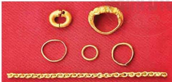
Hình 11.2. Đồ trang sức bằng vàng (Văn hoá Óc Eo)