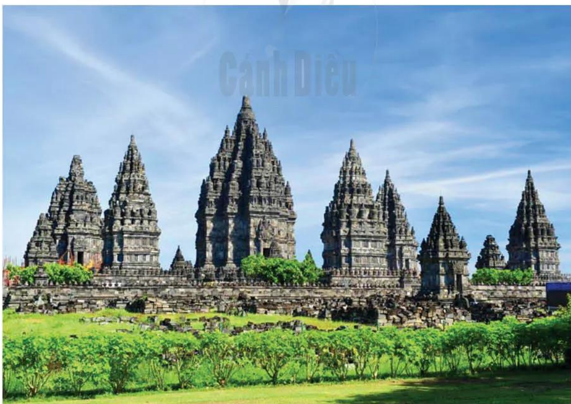
Hình 11.4. Đền Pram-ba-nan (In-đô-nê-xi-a, thế kỉ IX)

Phật giáo và Hin-đu giáo của Ấn Độ đã theo chân các nhà buôn, nhà truyền giáo vào Đông Nam Á, hoà nhập với tín ngưỡng dân gian của cư dân bản địa.