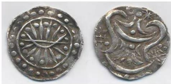
Hình 11.3. Tiền Phù Nam

Cư dân của Vương quốc Ca-lin-ga (miền Trung Gia-va, In-đô-nê-xi-a) có nhiều kinh nghiệm trồng lúa và buôn bán bằng đường biển nên đã nhanh chóng trở thành một vương quốc hùng mạnh ở khu vực phía nam Biển Đông. Họ từng đem quân vượt biển tấn công Chăm-pa (năm 774 và năm 787).