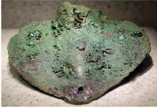
Hình 13.4. Lưới cây đồng Cổ Loa