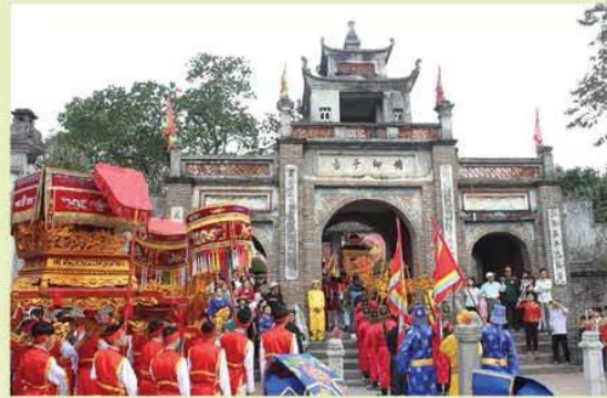
Hình 13.7. Lễ hội Cổ Loa

Lễ hội được tổ chức nhằm tưởng nhớ công lao của An Dương Vương và thể hiện đạo lí “Uống nước nhớ nguồn”, đồng thời duy trì, bảo tồn và phát huy hoạt động văn hoá truyền thống, giá trị di sản vật thể và phi vật thể của Khu di tích thành Cổ Loa.