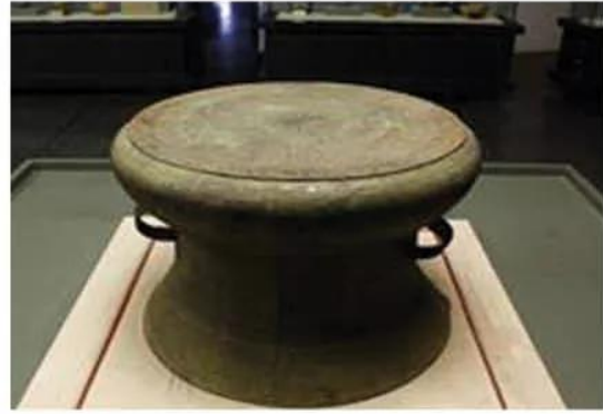
Hình 13.5. Trống đồng Cổ Loa