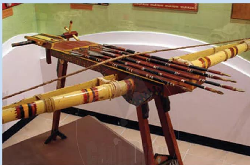
Hình 13.3. Nỏ Liên Châu (Mô hình do Bảo tàng Lịch sử Quân sự Việt Nam và Trung tâm Nghiên cứu tiền sử Đông Nam Á phục dựng năm 2010)

Nỏ Liên Châu là vũ khí đặc sắc của nước Âu Lạc. Tương truyền, nỏ Liên Châu do Cao Lỗ (vị tướng của An Dương Vương) chế tạo, có thể bắn một lần được nhiều phát, các mũi tên đều được bịt đồng sắc nhọn (có 3 cạnh). Theo sách Lĩnh Nam chích quái : “Cứ đem nỏ ra chữa vào quân giặc là chúng không dám đến gần”.