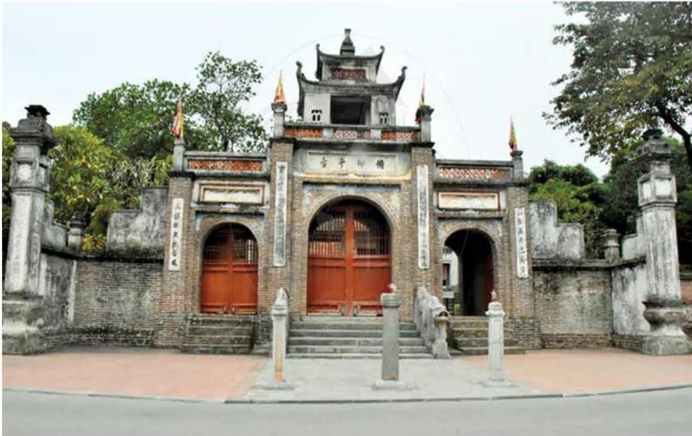
Hình 13.1. Cổng đền thờ An Dương Vương trong Khu di tích thành Cổ Loa

“An Dương Vương thế Hùng Vương, Quốc danh Âu Lạc cầm quyền trị dân”. (Lịch sử nước ta, Hồ Chí Minh)