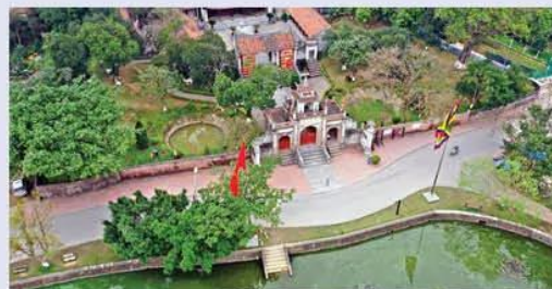
Hình 13.9. Khu di tích thành Cổ Loa (Đông Anh, Hà Nội)