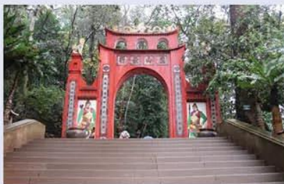
Hình 13.8. Cổng lên Khu di tích Đền Hùng (Việt Trì, Phú Thọ)

3. Dựa vào hình 13.1, hình 13.8, hình 13.9 và các thông tin em tìm hiểu được, hãy đóng vai là một hướng dẫn viên du lịch để giới thiệu về Khu di tích Đền Hùng và Khu di tích thành Cổ Loa.