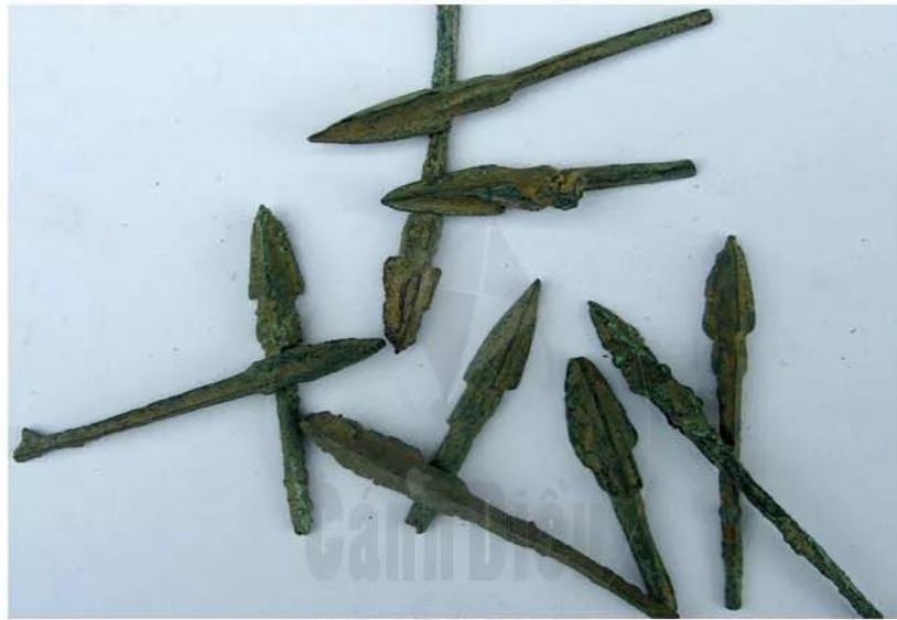
Hình 13.6. Mũi tên đồng Cổ Loa

Nhờ sản xuất phát triển, đời sống vật chất của cư dân Âu Lạc được nâng cao. Ngoài đồ ăn quen thuộc (cơm nếp, cơm tẻ, rau, cà, thịt, cá,...), cư dân còn ăn nhiều loại quả như chuối, cam,... Họ còn biết làm muối, mắm cá và dùng gừng làm gia vị.