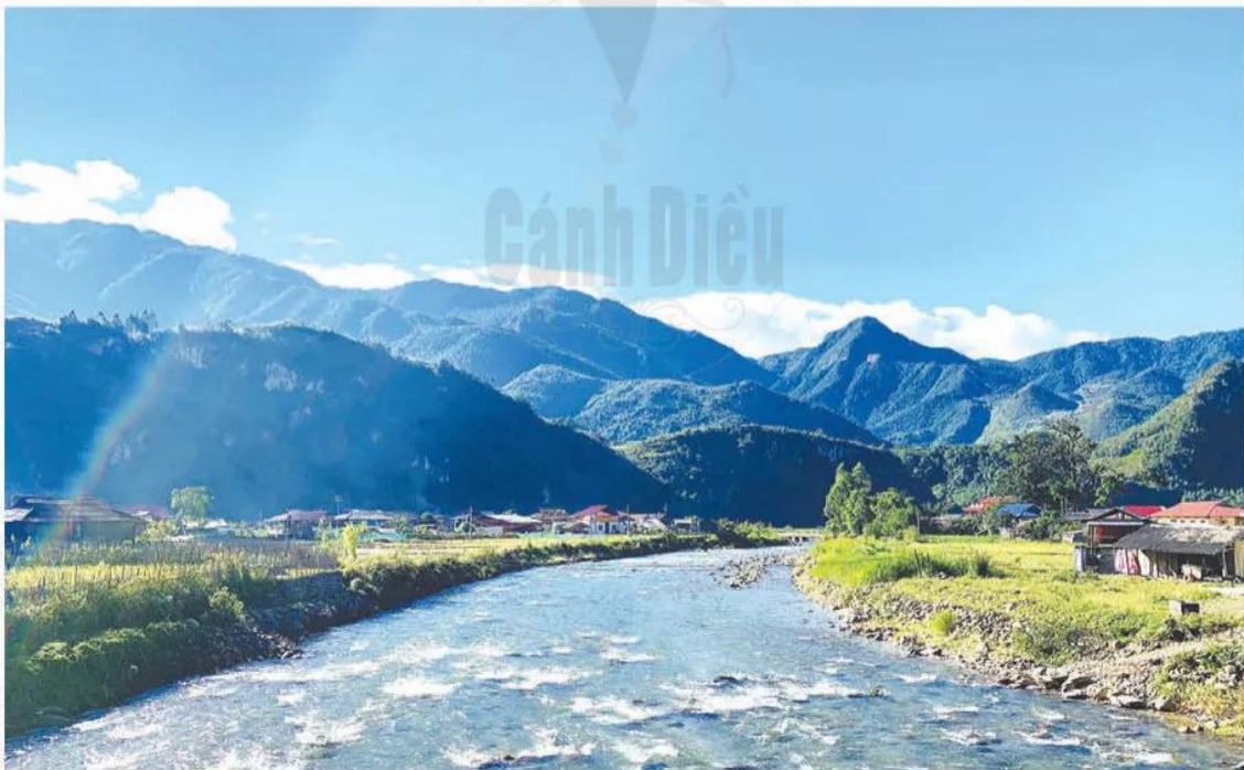
Hình 12.2. Một góc của vùng đồi núi Tây Bắc nước ta (ảnh chụp tại xã Ngọc Chiến, huyện Mường La, tỉnh Sơn La)