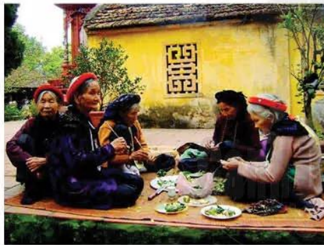
Hình 16.1. Tục ăn trầu của người Việt

Trước âm mưu đồng hoá của các triều đại phong kiến phương Bắc trong thời Bắc thuộc, người Việt đã đấu tranh bảo vệ và phát triển văn hoá dân tộc như thế nào?