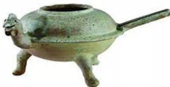
Hình 16.4. Ấm gốm men có vòi hình đầu gà (Tam Thọ, Thanh Hoá, thế kỉ VII – VIII)

Ấm được làm từ kỹ thuật gốm men của người Hán, nhưng vòi ấm trang trí hình đầu gà, con vật gần gũi của người Việt.