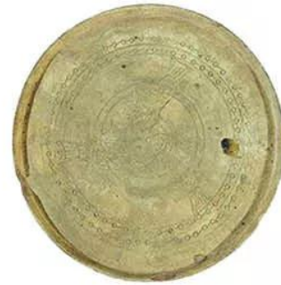
Hình 16.5. Khay gốm Lạch Trường (Thanh Hoá, thế kỉ II – III)

Trong thời Bắc thuộc, người Việt đã tiếp thu một cách chủ động và sáng tạo những giá trị văn hoá bên ngoài nhằm phát triển văn hoá truyền thống thêm đặc sắc và đa dạng. Trong đó, giao thoa văn hoá và sự xuất hiện của những yếu tố văn hoá mới là những xu hướng nổi bật. Điều này trước hết được thể hiện rõ qua các sản phẩm thủ công đương thời.