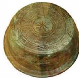
Hình 16.7. Mặt ngoài của chậu đồng Lạch Trường (Thanh Hoá, thế kỉ II – III)