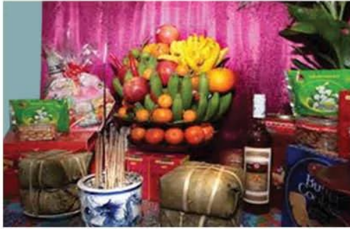
Hình 16.2. Tín ngưỡng thờ cúng tổ tiên vẫn được giữ gìn đến ngày nay