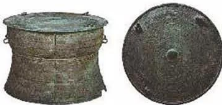
Hình 16.6. Trống đồng Tân Long (Hoà Bình, thế kỉ II – III)

Ở giữa khay gốm có hình ba con cá chụm đầu vào nhau, thể hiện ảnh hưởng của văn hoá Trung Quốc, nhưng viền ngoài của khay lại được trang trí hoa văn kiểu Văn hoá Đông Sơn.