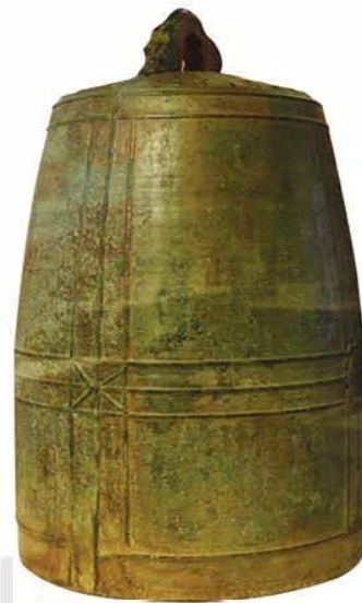
Hình 16.9. Chuông đồng Thanh Mai (Hà Nội, năm 798)

◀ Trên bia có nội dung: “Tất cả các bậc từ hoàng đế (...) đến thứ dân (...) đều thuận theo lời dạy của đức Phật, mãi thoát khỏi cõi khổ ải trầm luân, cùng hưởng quả phúc”.