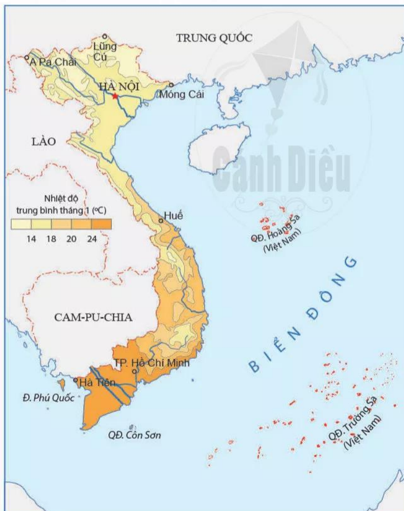
Hình 16.1. Lược đồ nhiệt độ trung bình tháng 1 ở Việt Nam