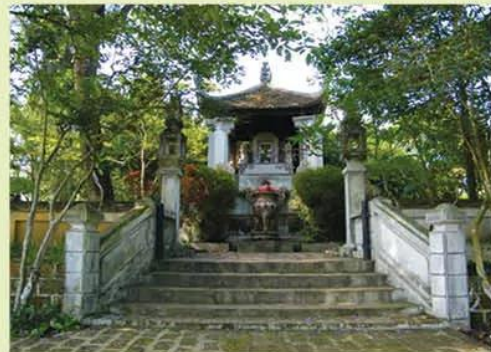
Hình 17.7. Lăng Ngô Quyền (Đường Lâm, Sơn Tây, Hà Nội)

Lăng được xây kiểu nhà bia có mái che, cao khoảng 1,5 m. Giữa lăng là ngai, trong có bia đá ghi bốn chữ Hán “Tiền Ngô Vương lăng” (Lăng mộ Vua Ngô Quyền).