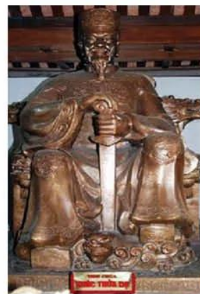
Hình 17.1. Tượng Khúc Thừa Dụ (Ninh Giang, Hải Dương)

Tương truyền, ông có tính khoan hoà, thương người, được dân chúng nể phục.