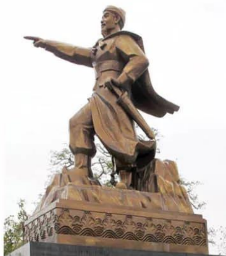
Hình 17.3. Tượng Ngô Quyền (Hải Phòng)

Lớn lên, Ngô Quyền đến vùng đất Ái Châu theo Dương Đình Nghệ. Trong cuộc chiến chống quân Nam Hán năm 931, Ngô Quyền lập được nhiều công lớn.