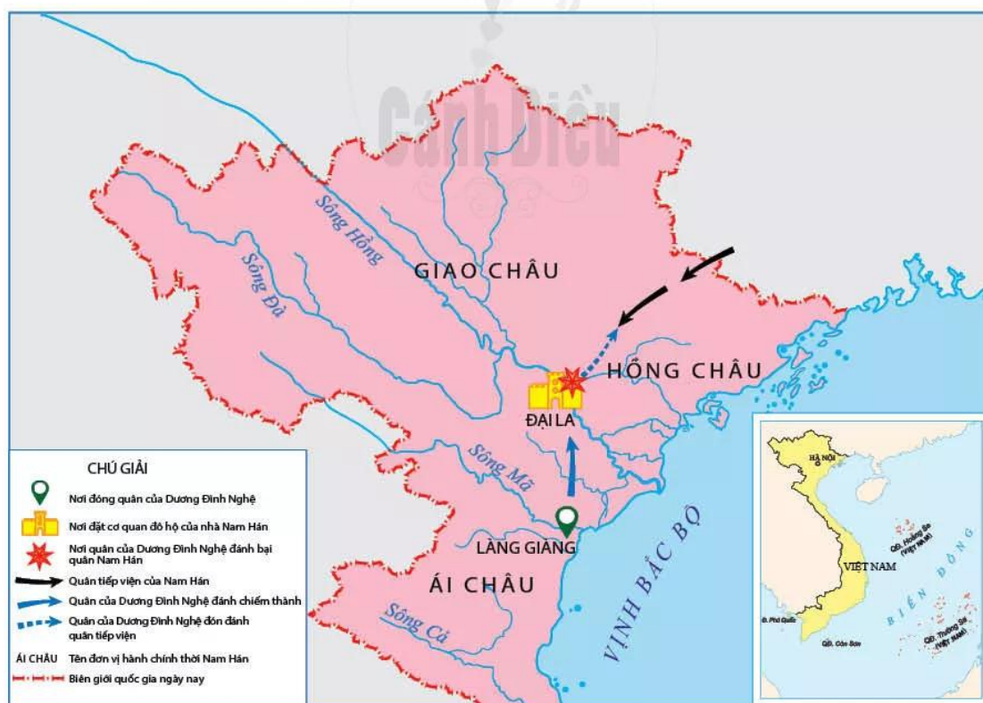
Hình 17.2. Lược đồ cuộc kháng chiến chống quân Nam Hán năm 931

Đầu năm 931, Dương Đình Nghệ – một tướng của họ Khúc – kéo quân từ Ái Châu tiến đánh và nhanh chóng làm chủ thành Đại La.