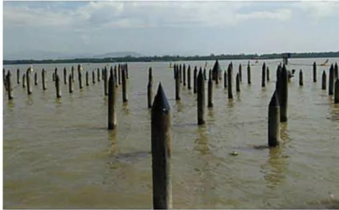
Hình 17.4. Tái hiện bãi cọc ngầm năm 938 ở cửa sông Bạch Đằng

Sông Bạch Đằng chảy giữa địa phận thị xã Quảng Yên (Quảng Ninh) và huyện Thủy Nguyên (Hải Phòng) ngày nay, sau đó đổ ra biển. Xưa kia, hai bên bờ hạ lưu sông Bạch Đằng có rừng rậm um tùm, nhân dân trong vùng gọi là sông Rừng. Tại khu vực cửa biển Bạch Đằng, khi thủy triều lên cao, lòng sông rộng mênh mông.