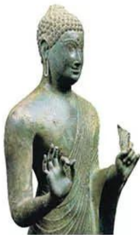
Hình 18.5. Tượng Phật Đồng Dương (tượng đồng, Quảng Nam, thế kỉ VIII - IX)

Cư dân Chăm-pa đã sáng tạo một nền văn hoá rực rỡ, đặc sắc.