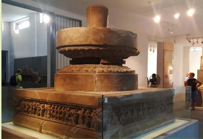
Hình 18.7. Đài thờ Trà Kiệu (Bảo tàng Điêu khắc Chăm)

Bảo tàng Điêu khắc Chăm (số 2, đường 2 tháng 9, quận Hải Châu, thành phố Đà Nẵng) là một trong những địa điểm tham quan hấp dẫn, trưng bày nghệ thuật điêu khắc của cư dân Chăm-pa cổ.