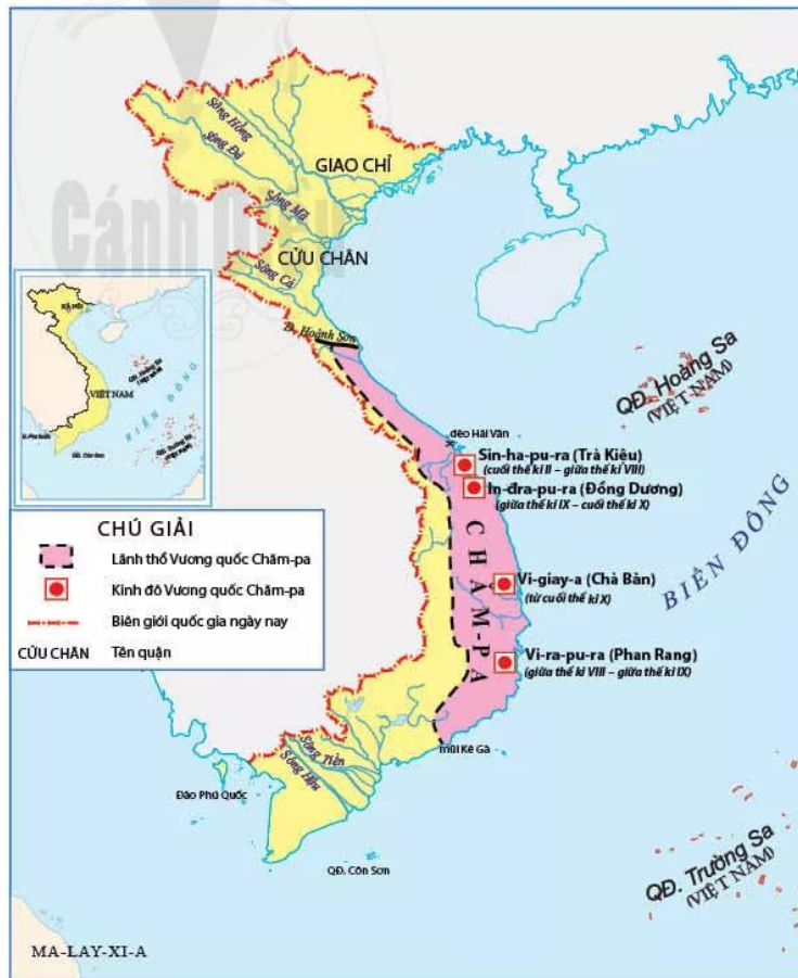
Hình 18.1. Lược đồ Vương quốc Chăm-pa (thế kỷ II – X)

Tượng Lâm là huyện xa nhất của quận Nhật Nam (nay thuộc Quảng Nam, Quảng Ngãi, Bình Định), vốn là địa bàn sinh sống của người Chăm cổ với nền Văn hoá Sa Huỳnh đã khá phát triển trong nhiều thế kỷ trước Công nguyên.