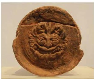
Hình 18.2. Đầu ngôi lợp có trang trí mặt sư tử (Bình Định, thế kỉ IV - VI)

Hoạt động kinh tế chủ yếu của cư dân Chăm-pa là sản xuất nông nghiệp trồng lúa nước, một năm hai vụ. Bên cạnh đó, nghề làm gốm, xây dựng, khai thác lâm sản, đóng thuyền, đánh bắt cá,... cũng rất phát triển. Đặc biệt, với vị trí thuận lợi, trong nhiều thế kỉ, Vương quốc Chăm-pa trở thành cầu nối trao đổi, buôn bán thường xuyên với thương nhân các nước như Trung Quốc, Ấn Độ, Ả Rập.