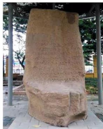
Hình 18.3. Bia Vô Cảnh (thế kỉ III - IV) Bảo tàng Lịch sử Quốc gia

– Chữ viết: chữ Phạn. – Nội dung gắn với đời vua Sri Ma-ra.