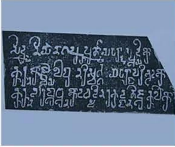
Hình 18.4. Bản dập chữ Chăm cổ (bia Đông Yên Châu, Trà Kiệu, Quảng Nam, thế kỉ IV)