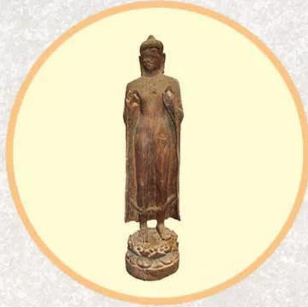
Hình 19.3. Tượng Phật Lợi Mỹ (tượng gỗ, Đồng Tháp, thế kỉ IV)