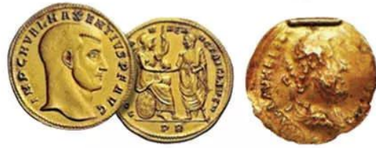
Hình 19.2. Tiền vàng La Mã tìm thấy trong di chỉ Ốc Eo (Gò Tháp, Đồng Tháp)

Phù Nam gồm nhiều tiểu quốc nên tổ chức nhà nước còn tương đối lỏng lẻo. Đứng đầu nhà nước là vua, nắm mọi quyền hành, giúp việc là các tầng lớp, quý tộc. Dưới vua là các thủ lĩnh quân sự hay thủ lĩnh địa phương chịu sự chi phối quyền lực của Phù Nam.