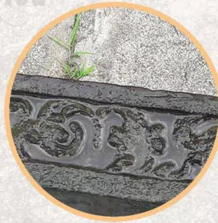
Hình 19.7. Hoa văn trên ván đong thuyền Phù Nam (điều khắc gỗ, Đồng Tháp, thế kỉ VI - VII)

? Quan sát các hình từ 19.3 đến 19.7 và đọc thông tin, hãy kể tên một số thành tựu văn hoá của cư dân Phù Nam.