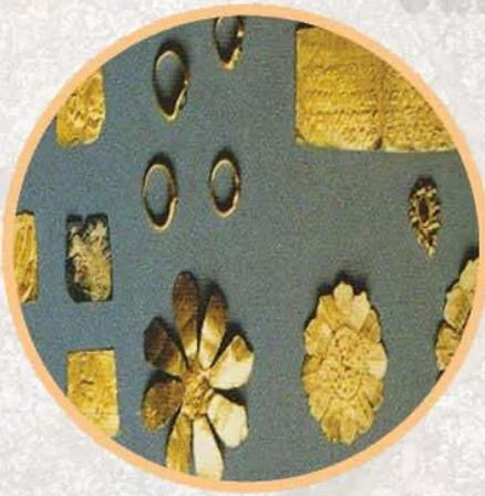
Hình 19.6. Bộ sưu tập trang sức Phù Nam