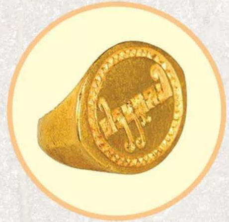
Hình 19.5. Chữ Phạn khắc trên nhẫn vàng (Ôc Eo, thế kỉ V - VI)