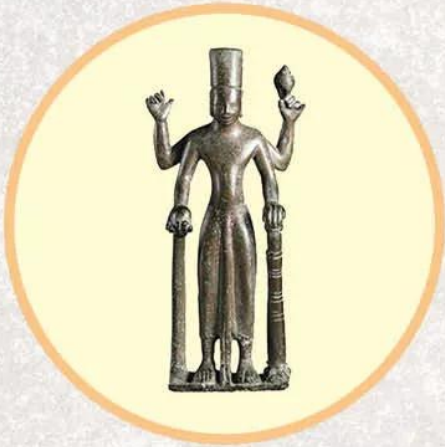
Hình 19.4. Tượng Vit-nu Tân Hội (tượng đồng, An Giang, thế kỉ III - V)